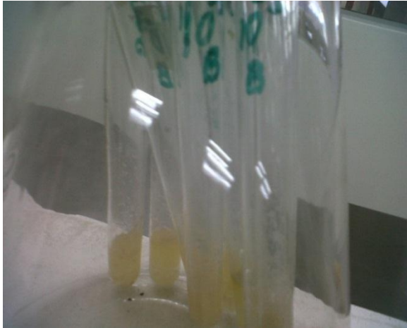
Fig. 2. Ensayo en salchicha de pescado conservada con lactato de sodio.

disminuyó la L. monocytogenes en números de 0,4 a 0,8 log UFC/g por más de 120 días en comparación con el tratamiento control.