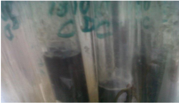
Fig. 4. Ensayo en salchicha de pescado sin conservantes.