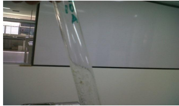
Fig. 1. Ensayo en salchicha de pescado conservada con nitritos.

Con este tratamiento, las esporas de Clostridium sulfito reductor no crecieron en ninguna de las diluciones realizadas, al igual que en otros estudios la calidad microbiológica de embutidos tipo pepperoni durante la fermentación de este (ver Fig. 1), se comprobó la ausencia de los microorganismos patógenos empleando nitritos y cloruro de sodio [11]. Así mismo en investigaciones previas sobre la influencia de especias en salchichas bratwurst el crecimiento de esporas de C. reductor (<10) no fue tan significativo a pesar que no se utilizó en la formulación nitritos, sin embargo, cuando no se utilizan este tipo de sales el crecimiento de este microorganismo puede crecer en mayor grado, aunque la utilización de especias naturales contribuyen a reducir la carga microbiana en este tipo de productos [12].