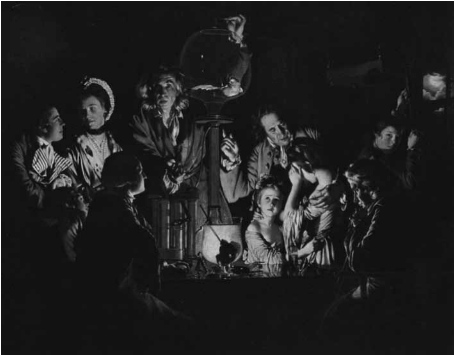
AN EXPERIMENT ON A BIRD IN THE AIR PUMP 1768.