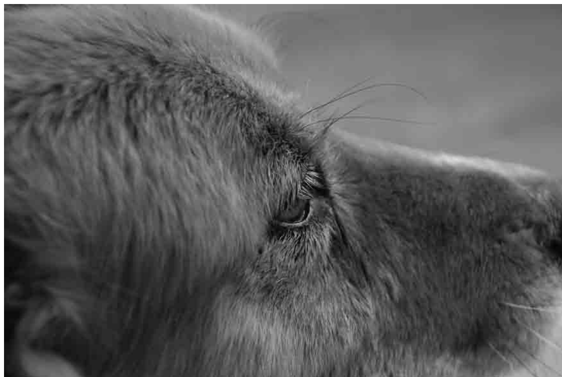
DANGER, PERRO CALLEJERO, 2008 Fotografía de Leonardo Montenegro Martínez