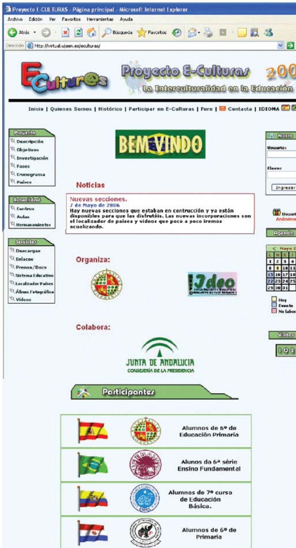
Figura 1. Página principal de E-Culturas

Pero el proyecto está abierto a cualquier otro país que desee participar en el mismo, para lo cual cuenta con un sencillo formulario que una vez cumplimentado se envía de forma inmediata. Se accede desde "Participar en E-Culturas" (figura 2):