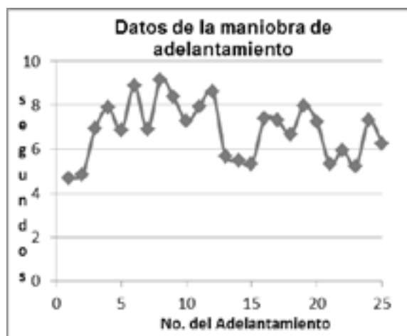
Fig. 2. Tiempos de la maniobra medidos