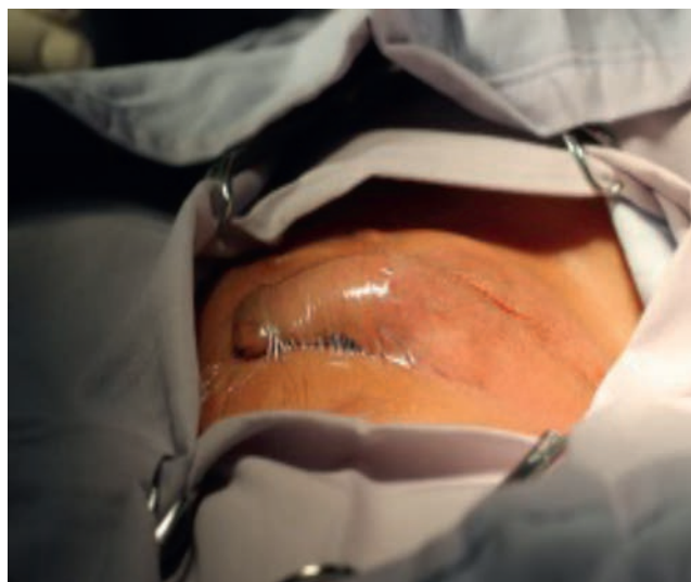
Figura 1 Aislamiento del pene con tegaderm.

criptorquidia unilateral o bilateral y parálisis cerebral. Las variables incluidas fueron: parálisis cerebral, criptorquidia unilateral, criptorquidia bilateral, criptorquidia recidivante, edad, lugar de residencia, tiempo operatorio, presencia o ausencia de infección postoperatoria y técnica quirúrgica vía escrotal. El comité de ética en investigación del CRIT Puebla dictaminó como aprobado este protocolo de investigación. El responsable legal del paciente firmó el consentimiento informado, recibió información detallada del procedimiento, además se entregó tríptico informativo acerca del procedimiento quirúrgico, a todos los pacientes se les solicitó biometría hemática completa y tiempos de coagulación completos, todos tuvieron valoración preanestésica. El procedimiento fue ambulatorio, la técnica anestésica empleada fue bloqueo peridural caudal, se realizó aseo quirúrgico abdominal y genital con clorhexedina mediante un dispositivo cerrado y estéril, se aplicó preoperatoriamente ceftriaxona por vía intravenosa cuya dosis fue calculada según los kilos de peso de cada paciente a 100 mg/kg en dosis única; se aisló el pene colocando tegaderm sobre él para evitar manipularlo durante el procedimiento quirúrgico (fig. 1), y la operación se realizó