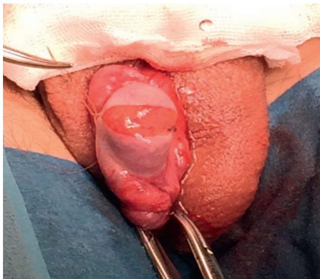
Figura 1 Técnica quirúrgica. Disección del parénquima testicular.

Previa asepsia y antisepsia regional con el paciente bajo sedación, se realizó una incisión de la túnica albugínea en el plano ecuatorial, realizando disección del parénquima testicular (fig. 1). Se colocó microscopio, logrando identificar los túbulos seminíferos. Siguiendo la técnica, al no encontrar inicialmente espermatozoides, fue necesario disecar extensamente los polos testiculares, la túnica albugínea fue incidida ecuatorialmente aproximadamente 270 grados de la circunferencia testicular preservando los vasos por debajo