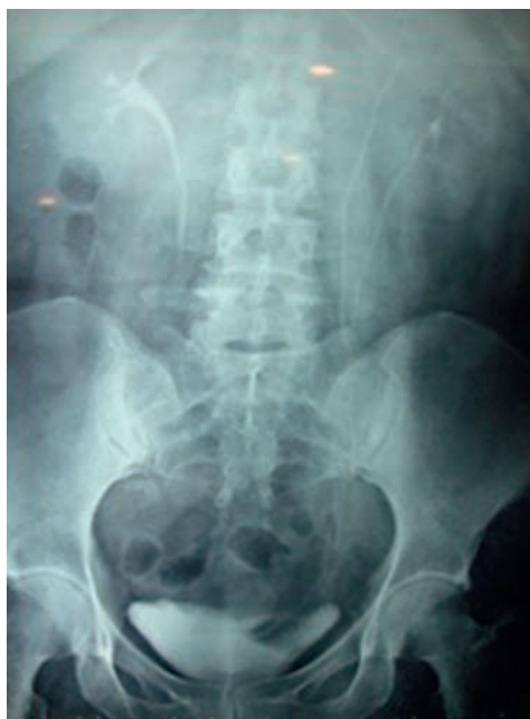
Figura 1 La urografía excretora muestra claramente doble sistema colector completo y ureterocele ortotópico izquierdo.

Se realiza urografía excretora, encontrando datos de doble sistema colector completo y ureterocele ortotópico del lado izquierdo (fig. 1) por lo que se decide realizar uretero-ureteroanastomosis del uréter superior al inferior (fig. 2) y colocar un catéter ureteral doble J izquierdo permitiendo así el libre paso de orina hacia la vejiga (fig. 3). La paciente se mantuvo sin complicaciones posquirúrgicas inmediatas o mediatas y se retiró el catéter ureteral doble J 21 días después de la cirugía sin complicaciones. Se ha