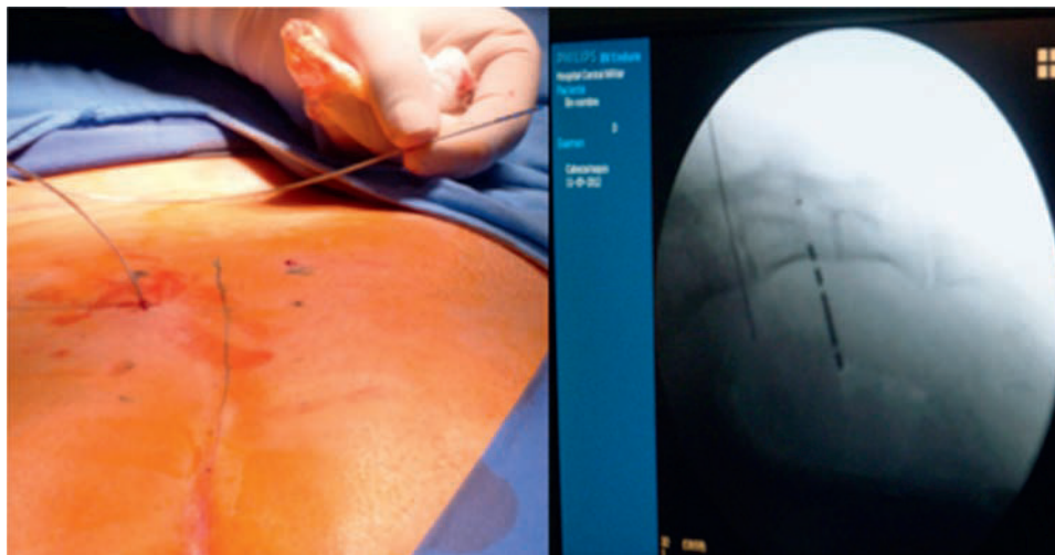
Figura 2 Con el auxilio de la fluoroscopia se guía la colocación del electrodo de anclaje.

software específico y bajo licencia de Qualitymetrics de los instrumentos de evaluación empleados.