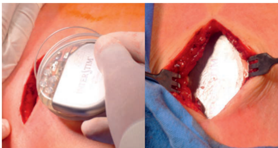
Figura 3 En la fase definitiva se coloca el neuromodulador en el reservorio subcutáneo.

El análisis de los parámetros comparativos se realizó en la población total incluida en el estudio. Así mismo se realizó análisis separado por género y patologías (tabla 3).