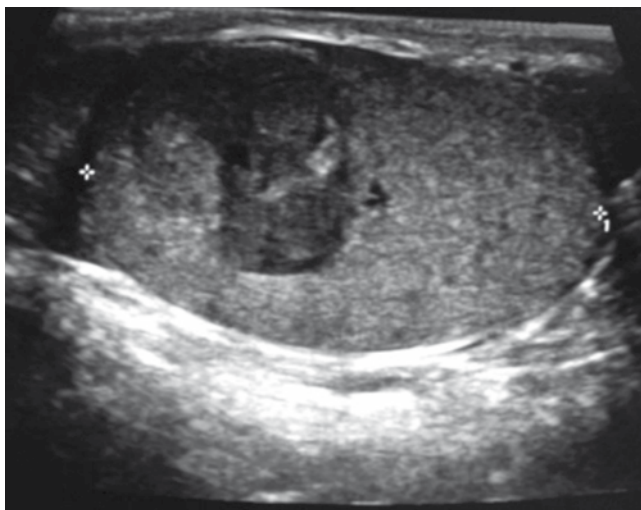
Figura 1 Caso 2. Ultrasonido escrotal que muestra tumoración intratesticular derecha de 1.5 cm de diámetro.