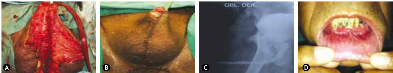
Figura 3 A) Cierre completo del cuerpo esponjoso sobre el injerto. B) Aspecto postoperatorio inmediato. C) Uretrocistograma miccional de control. D) Aspecto de la mucosa oral a los 2 meses.

Por último, Kumar et al. 22 usando también la técnica descrita por Kukarni, trató 40 pacientes, de los cuales 20 tenían EPU asociada a LE (estenosis promedio de 14.5 cm) y 20 presentaban EPU de origen inflamatorio o idiopático (estenosis promedio de 14 cm), reportando una recurrencia de estenosis postoperatoria del 35% en el grupo de LE, así como una incidencia más alta de complicaciones.