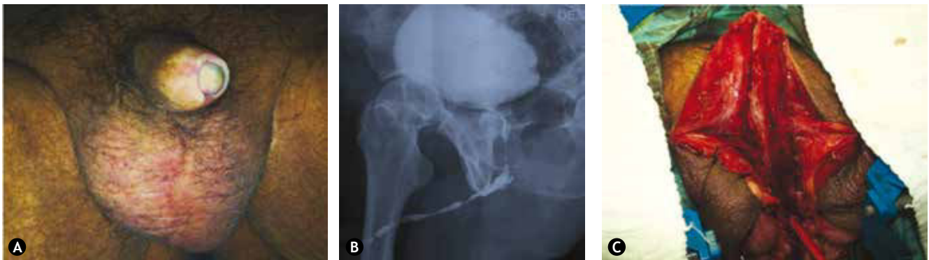
Figura 1 Paciente uno. A) Apariencia común del liquen escleroso y atrófico genital. B) Uretrocistograma de choque preoperatorio. C) Disección completa de la uretra afectada.

Los pacientes fueron valorados regularmente mediante una uroflujometría y un cuestionario validado para pacientes postoperados de plastia uretral 9 . Al mismo tiempo, se evaluaron las complicaciones postoperatorias y se agruparon de acuerdo a la clasificación de Clavien-Dindo 10,11 . La necesidad de efectuar algún otro procedimiento para restablecer la micción espontánea se consideró como fracaso.