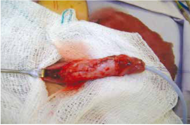
Figura 3 Se realiza cierre de uretra sobre sonda Foley 8Fr, con sutura PDS™ 6-0 en 2 planos, se coloca parche de fascia subdérmica.

Podemos definir los divertículos uretrales del hombre como “primarios” de origen congénito y “secundario” de origen adquirido 2 . Estos pueden encontrarse a lo largo de la uretra anterior, sin embargo lo más frecuente es a nivel de la uretra bulbar; estos se pueden dividir en 2 variedades, sacular y globular, según su apariencia radiológica y a excepción de la fosa navicular casi siempre surgen en la pared ventral de la uretra 3 . Los divertículos congénitos de la uretra son una patología muy rara que puede ocasionar obstrucción urinaria o infecciones, así como otra sintomatología dependiendo del tamaño y tipo de divertículo. Aparentemente los signos y los síntomas derivados de esta enfermedad son típicos y el diagnóstico es sencillo, no obstante muchos niños afectados por este padecimiento permanecen sin diagnosticarse 2 . La causa embriológica permanece desconocida, habiéndose postulado varias teorías como falla en el cierre de los pliegues uretrales, atrofia primaria de la pared central de la uretra, falla en el desarrollo de las capas uretrales, alteración del riego sanguíneo y falla en el desarrollo del cuerpo esponjoso 2 . La experiencia clínica evidenciaría que apenas un 10% de todos los divertículos reconocerían este origen 2 .