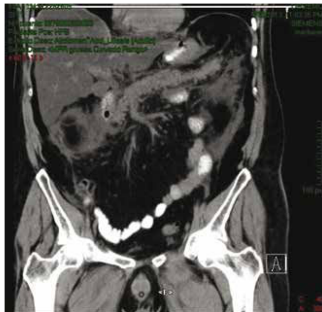
Figura 2 Caso 2. Tomografía axial computarizada abdominal con evidencia de pancreatitis, Balthazar E.

tórpida con insuficiencia renal aguda, deterioro ventilatorio y circulatorio, con defunción en ambos casos.