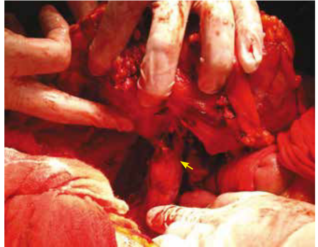
Figura 3 Tumor renal con involucro de vena cava (flecha). Evento quirúrgico.

En la mayoría de los pacientes con tumores renales metastásicos, la nefrectomía es generalmente paliativa y son necesarios tratamientos sistémicos. Al comparar la nefrectomía sola contra la nefrectomía combinada con inmunoterapia, se ha observado que la segunda presenta un mayor aumento en la supervivencia a largo plazo 3 . La nefrectomía está indicada en pacientes con enfermedad metastásica que son candidatos a la cirugía y que presentan un adecuado estado funcional 5 .