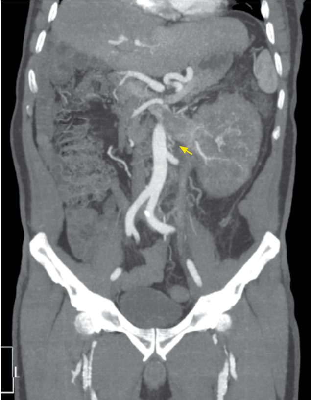
Figura 2 Tomografía axial computarizada, corte coronal.

El paciente cursó su postoperatorio en regulares a buenas condiciones generales, sin datos de complicación. Por lo anterior, se decide su egreso 4 días después de la cirugía. La clasificación final fue T4N1M1, pues el reporte histopatológico demostró un carcinoma renal de células claras con grado nuclear Furrhman 4, extensión al tejido adiposo perirrenal, invasión de la fascia de Gerota, invasión perineural, vena renal y cava con trombo y glándula suprarrenal con metástasis. Se realiza angiografía de control para valorar flujos venosos colaterales, encontrando recanalización a través de lumbares. Después de la cirugía, el paciente cursó asintomático en relación a hipertensión venosa o aumento de volumen de extremidades inferiores; se dejó con anticoagulación a permanencia y está siendo valorado por los cirujanos vasculares frecuentemente. Actualmente, se encuentra pendiente la valoración por el Servicio de Oncología Médica para inicio de terapia blanco con sunitinib.