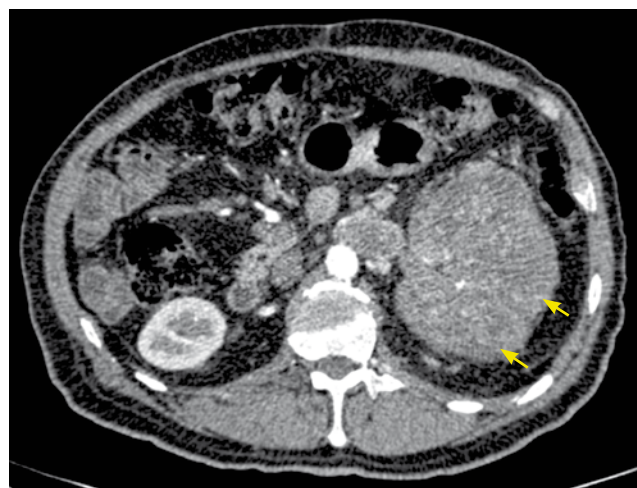
Figura 1 Tomografía axial computarizada, corte axial. Se identifica claramente tumor renal izquierdo (flechas).

Se somete a nefrectomía radical y durante el transoperatorio se confirma vena cava inferior en situación izquierda, con trombo tumoral en su interior, tal como se había observado en la tomografía; también se nota la presencia del segmento proximal de la vena cava inferior dentro del tumor (fig. 3). Se realiza nefrectomía con control vascular (fig. 4) y trombectomía proximal de vena cava, obteniendo trombo tumoral con maniobra de Valsalva y cerrando muñón de vena cava inferior con doble línea de Prolene® 6-0, doble armado.