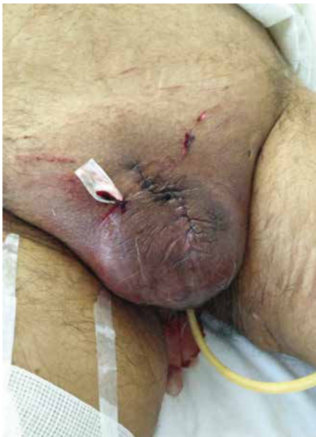
Figura 4 Posquirúrgico inmediato con uretrotomía perineal.

arterias, las calcificaciones intravasculares pueden tener su origen en el hiperparatiroidismo secundario a hiperfosfatemia. Este hiperparatiroidismo conlleva al aumento de la absorción intestinal de calcio y su reabsorción renal. Este estado condiciona el aumento de calcio en sangre y su depósito en los tejidos (calcifilaxis).