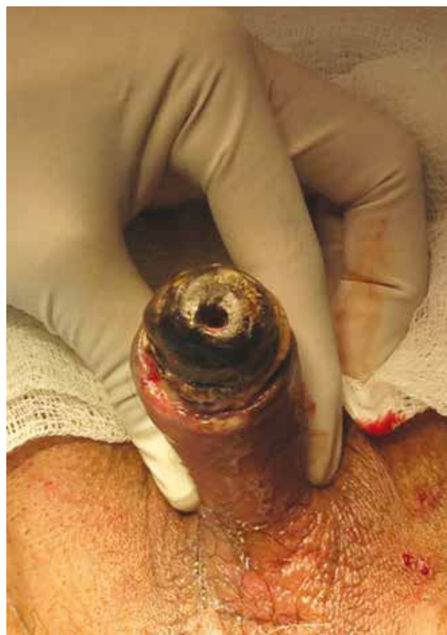
Figura 1 Necrosis de pene.

Dos semanas posteriores al evento quirúrgico, se encuentra escara de 10 x 15 cm, con salida de abundante material purulento fétido.