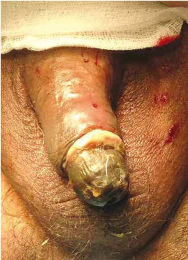
Figura 2 Datos de balanitis y escara.

Laboratorios: leucocitos 15,100/mm 3 , hemoglobina 8.3, hematocrito 26.7, plaquetas 275,000, glucosa 105, urea 82, creatinina 3.70, Na + 141, K + 4.3, Cl - 102, albúmina 1.99, TP 20.6, TTP 72.5, Ca +2 7.92 mmol/L, fósforo 7.36 mmol/L.