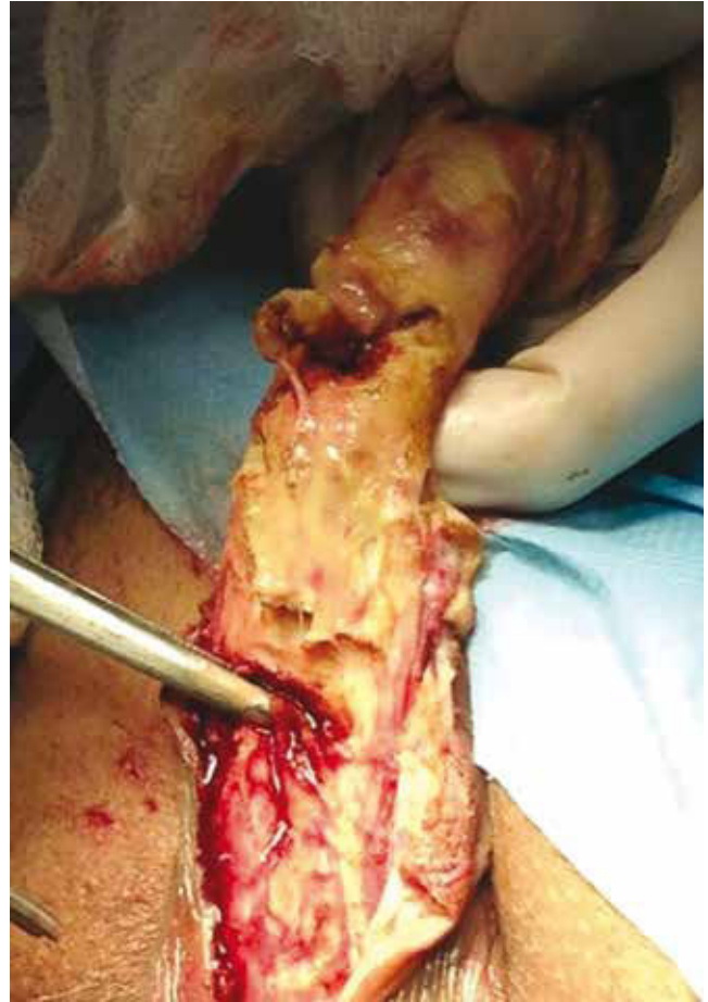
Figura 3 Compromiso de los tejidos y la uretra en el transquirúrgico.

La calcifilaxis es una condición sistémica poco común, se observa en el 1%-4% de los pacientes con insuficiencia renal crónica terminal en tratamiento sustitutivo, la presentación clínica consiste en manchas rojizas en la piel y lesiones