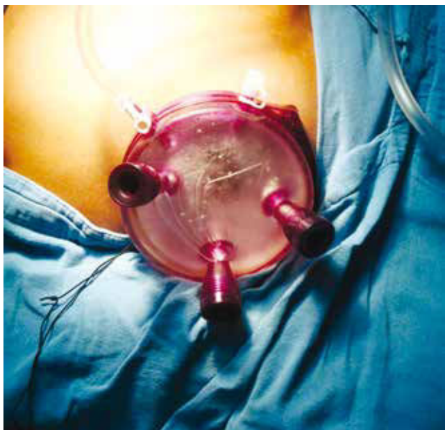
Figura 1 Gel Point Advanced Access Plataform™ colocado a través de una incisión umbilical de 4 cm. Nótese la presencia de 3 trocares en este dispositivo.

adecuada del pedículo renal. Cuando procedemos a realizar una cirugía radical posterior a identificar la vena gonadal, la clipamos y procedemos a cortarla logrando una mejor exposición o acceso de la vena lumbar y de la arteria renal, identificamos completamente vena renal y afluentes, grapando estas últimas, la arteria renal es identificada y asegurada con Hem-o-lok®, posteriormente la vena renal. En cirugía radical clipamos también la vena adrenal (fig. 2). El espécimen es extraído generalmente en una bolsa de glicina con jareta, la cual se introduce quitando la plataforma de acceso. Se verifica la hemostasia colocándose el drenaje, generalmente Penrose.