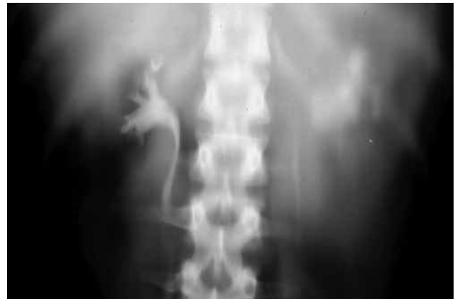
Figura 2 Urografía excretora en corte de tomografía, en la cual se aprecia pobre definición de cáliz renal y pelvis renal con material de contraste.

los síntomas ginecológicos, incluyendo hemorragia vaginal y crecimiento uterino, además de signos y síntomas relacionados con altas concentraciones séricas de hGC- \beta , como amenorrea, malestar general e hiperemesis 8 . En una serie de 134 pacientes con ETG metastásica, el 17% tenía ETG de alto grado (enfermedad metastásica fuera de pulmones, vagina o pelvis) 1 , de los cuales el 88% tenía síntomas de enfermedad extrapulmonar. Una de las características que distinguen al coriocarcinoma, es su rápido crecimiento temprano y metástasis a cualquier órgano. Pacientes con metástasis cerebrales presentan cefalea, convulsiones o hemiparesias; y con metástasis pulmonares pueden presentar hemoptisis, dolor pleural y disnea 1,9 .