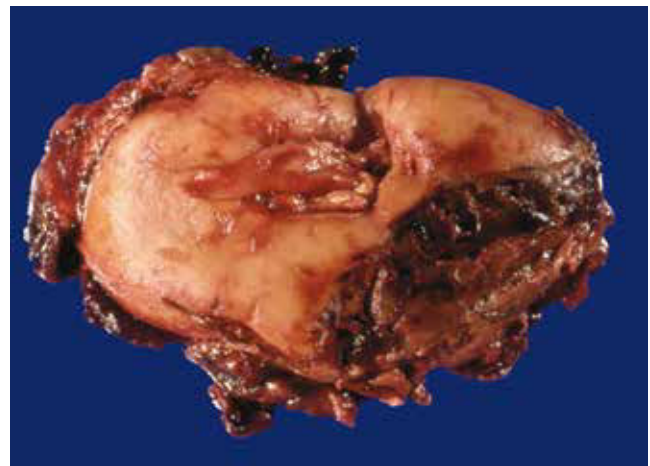
Figura 3 Pieza quirúrgica: riñón izquierdo con lesión tumoral que deforma el polo superior, con áreas de necrosis y coágulos.

El ultrasonido es el estudio de imagen inicial en el abordaje diagnóstico de la ETG, sin olvidar la cuantificación de hGC- \beta . La enfermedad metastásica se puede evaluar con imágenes por TC de tórax y abdomen, resonancia magnética cerebral y ultrasonido Doppler pélvico. Diversos autores recomiendan ante una resonancia magnética cerebral sin imágenes sugestivas de lesiones metastásicas, realizar una