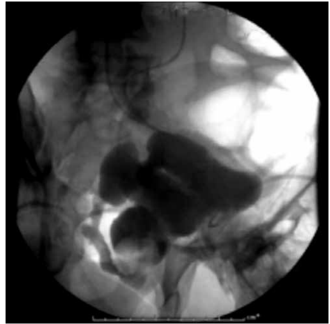
Figura 3 Cistografía con dehiscencia de anastomosis.

Na + : sodio; K + : potasio; Cl - : cloro; TP: tiempo de protrombina; TPP: tiempo parcial de tromboplastina; INR: International Normalized Ratio .