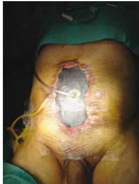
Figura 4 Sistema V.A.C.

postoperatoria sin complicaciones, con adecuado funcionamiento del conducto ileal, ya sin complicaciones intestinales o urinarias. Se egresó al quinto día de postoperado. En el seguimiento por Consulta Externa, persiste sin complicaciones derivadas de la derivación urinaria.