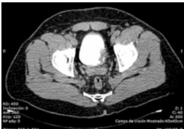
Figura 1 Urotomografía.

Se inició protocolo de hematuria (tabla 1), realizando estudios de laboratorio. En la urotomografía (UroTAC) se pudo identificar un tumor vesical dependiente de pared lateral izquierda, por lo que se realizó cistoscopia con resección transuretral de vejiga (RTUV), encontrándose un tumor vesical en la pared lateral izquierda de 3 cm, de aspecto papilar, el cual se resecó de manera completa (16/01/2012) (fig. 1). El reporte histopatológico fue de carcinoma papilar urotelial de alto grado, con invasión al músculo detrusor. Se realizó posteriormente biopsias de cuello vesical y próstata, las cuales se reportaron negativas a malignidad (24/02/12). Se programó para realizar cistoprostatectomía radical con derivación urinaria mediante neovejiga ortotópica tipo Studer (12/03/12), realizándose sin complicaciones perioperatorias (fig. 2). Al tercer día de postoperado inició con salida de material serohemático a través de la herida quirúrgica, la cual se manejó como un seroma, con drenaje y curaciones de la herida. Al sexto día de postoperado se inició dieta, la cual fue bien tolerada; presentando fiebre de 38.5°C sin leucocitosis. El 22/03/12 se evidenció dehiscencia de la aponeurosis por lo que se realizó LAPE, encontrándose la mencionada dehiscencia y material purulento en la cavidad abdominal, por lo que se decidió manejar con abdomen abierto y bolsa de Bogotá (fig. 3). El 27/03/12 presentó