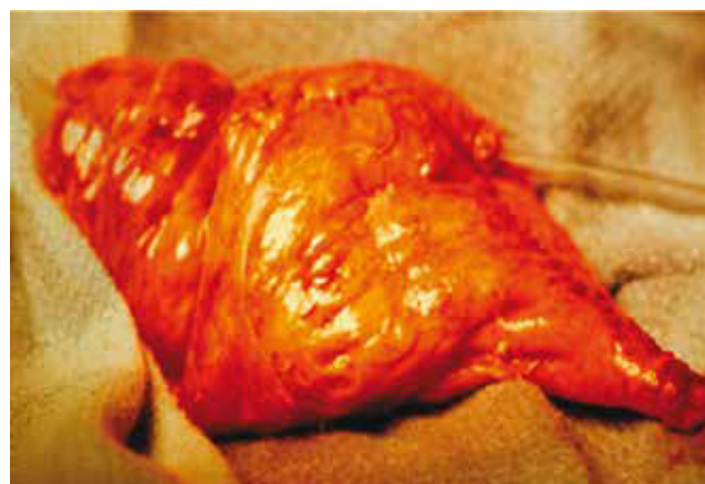
Figura 2 Neovejiga tipo Studer.