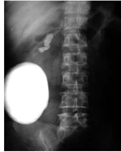
Imagen 3. Placa simple de abdomen con litio de 8 x 8 cm.

intensidad, suprapúbico y sin irradiaciones, el cual disminuía con el reposo y analgésicos, sin aumento de su intensidad. Abdomen con estoma en el flanco derecho. Pruebas de laboratorio: Hb, 13.90; Hto, 40.50; leucocitos, 9.10; plaquetas, 327; glucosa, 75; creatinina, 0.8; urea, 22.7; ácido úrico, 5.4; Na, 146; Cl, 110; K, 3.3. La placa simple de abdomen muestra una imagen radiopaca a nivel del hueso pélvico de 5 x 4 cm irregular. La asografía señala llenado adecuado, sin fuga. La urografía excretora proyecta una imagen radiopaca a nivel del hueso pélvico.