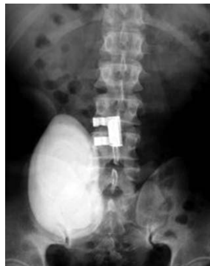
Imagen 1. Placa simple de abdomen con lito gigante en la bolsa ileal de 15 x 10 cm.

Caso clínico 2. Mujer de 27 años con antecedentes patológicos de espina bífida, sometida a los 19 años a un procedimiento de reservorio ileal por microcisto e incontinencia urinaria y litotripsia en el 2001. El padecimiento tiene dos meses de evolución y se caracteriza por dolor al momento de cateterizarse para el vaciamiento del reservorio; presenta de manera ocasional hematuria de leve intensidad, sin coágulos, con aparición de dolor lumbar bilateral, motivo por el cual acudió al servicio; los estudios de laboratorios mostraron Hb, 15.9 g/dL; Hct, 47.9; plaquetas, 292; leucocitos, 6.6; TP, 14 seg; TPT, 82%. El examen general de orina reveló una densidad de 1.015, coloración ámbar turbia, pH de 8.0,