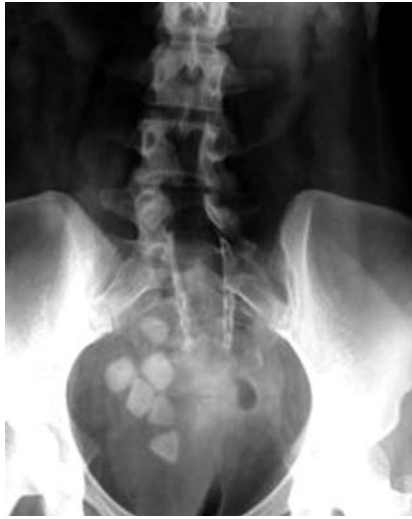
Imagen 2. Placa simple de abdomen con seis litos en la neovejiga.