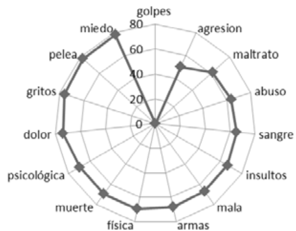
Gráfica 1. Núcleo de la red semántica de “violencia”

realizamos esta investigación, la violencia está estrechamente relacionada con manifestaciones físicas y en menor proporción psicológicas, está caracterizada por situaciones en las que existe abuso, y se percibe como mala o dañina para las personas (Ver Gráfica 1).