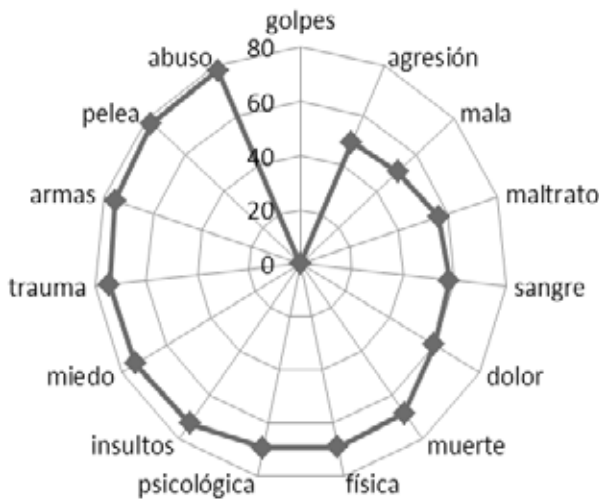
Gráfica 2. Distancia semántica de las definidoras de los jóvenes hombres de bachillerato

Al realizar un análisis más profundo de las definidoras que utilizan los jóvenes y las jóvenes, encontramos que mientras los hombres relacionan la violencia con situaciones de carácter físico y que se sustentan en situaciones sociales que contribuyen a la aparición de estos hechos, las mujeres la relacionan principalmente con características psicológicas y emocionales, situándose como vulnerables ante situaciones de violencia, en las que existe una desigualdad de condiciones (Ver Gráficas 2 y 3). Esto mismo se refleja en los estudios de la SEP, en los que se muestra que el estereotipo típico de hombre y de mujer contempla que él debe ser fuerte y protector de ella, quien es percibida como débil y responsable de las labores propias de organizar a la familia.