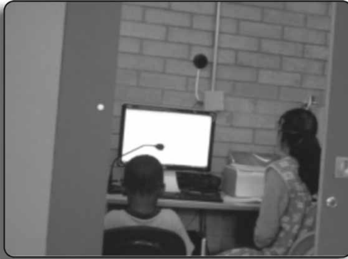
Figura 4. Fotografía tomada por una niña de 4 años y 2 meses

Al usar las fotografías se permitió a los niños y niñas elegir, además, evitar el deseo de copiar de muestra de sus demás compañeros y compañeras;