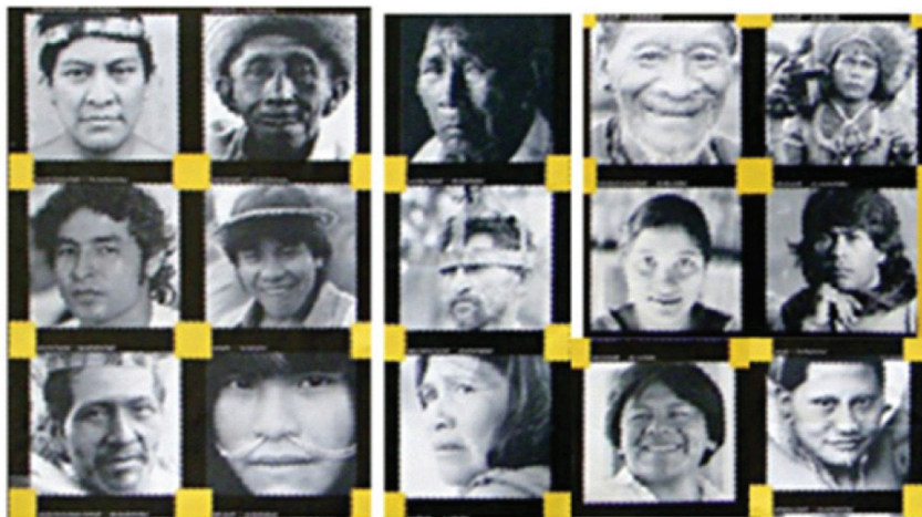
Figura 2 – Exemplos da sociodiversidade indígena no Brasil. 3

Desta constatação histórica importa destacar que, quando falamos de diversidade cultural indígena, estamos falando de diversidade de civilizações autônomas e de culturas; de sistemas políticos, jurídicos, econômicos, enfim, de organizações sociais, econômicas e políticas construídas ao longo de milhares de anos, do mesmo modo que outras civilizações dos demais continentes europeu, asiático, africano e a Oceania. Não se trata, portanto, de civilizações ou culturas superiores ou inferiores, mas de civilizações e culturas equivalentes, mas diferentes. (Baniwa, 2006, p.49)