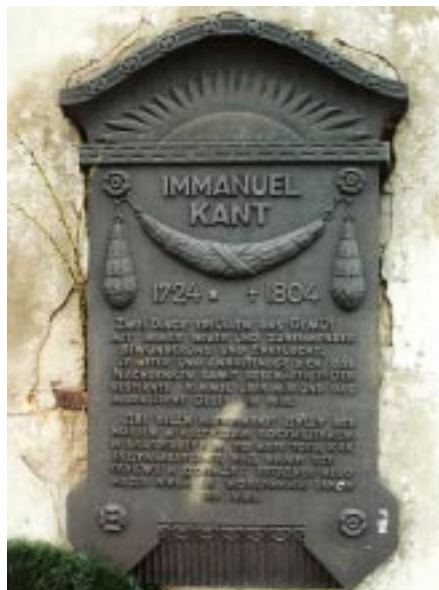
Placa Conmemorativa a Immanuel Kant

comprendemos a partir de una red de reglas (clasificar, deducir, transformar, etc). El saber se reestructura a partir de condiciones previas, incrementando su coherencia y universalidad. Esta evolución se produce, tanto en la sicogénesis del individuo como en la historia de las ciencias.