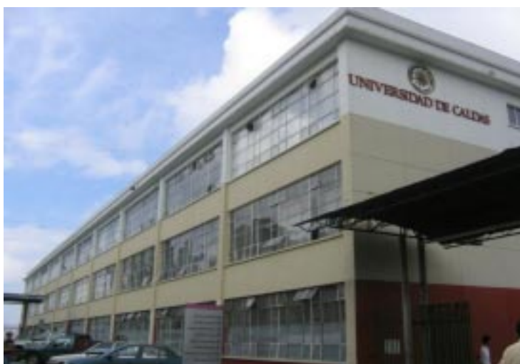
Universidad de Caldas Manizales - Colombia

PRIMERA. Objeto. Establecer las bases específicas del convenio multilateral de cooperación del programa de “Doctorado en Ciencias de la Educación con énfasis en Historia de la Educación”, entre las universidades participantes. SEGUNDA. El Programa de Doctorado. Su definición y especificidad académica, científica, administrativa y financiera corresponden al documento aprobado por el Consejo Superior de la UPTC que se adjunta