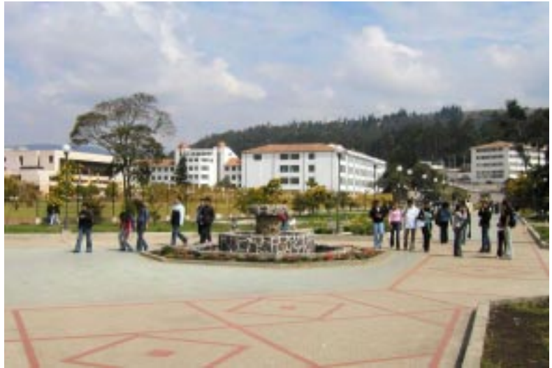
Universidad Pedagógica y Tecnológica de Colombia Tunja