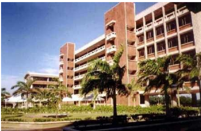
Detalle Universidad del Atlántico Colombia

en el doctorado los nombres de las universidades de convenio. h) Dar prelación a las universidades del convenio en todas las actividades académicas, de investigación y extensión que se desarrollen en el doctorado. QUINTA. Obligaciones de las Universidades: Distrital “Francisco José de Caldas”, del Cauca, de Cartagena, de Nariño, del Tolima, Tecnológica de Pereira y de Caldas. a) Conceder una comisión remunerada y el pasaje a los profesores con título de Doctor en Historia y áreas afines, de las universidades del convenio, que colaboren como docentes del Programa de Doctorado, durante el tiempo establecido en el plan anual de actividades por el Comité Académico del Doctorado. b) Pagar el costo de la matrícula y otorgarle la comisión de estudios remunerada al profesor que las universidades del convenio envíen a realizar el doctorado. c) Colaborar por partes iguales, con los pasajes que se deban financiar de profesores extranjeros visitantes del doctorado. d) Garantizar el desplazamiento, alojamiento y estadía de los profesores extranjeros a las conferencias programadas en las universidades del convenio. e) Colaborar,