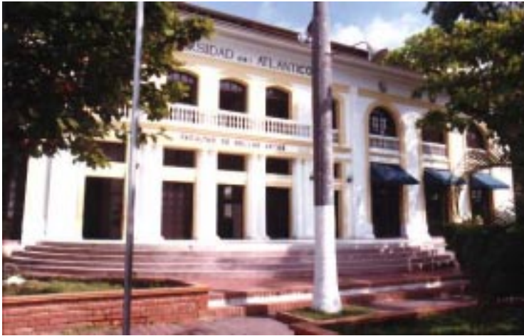
Detalle Universidad del Atlántico Colombia

en el doctorado los nombres de las universidades de convenio. h) Dar prelación a las universidades del convenio en todas las actividades académicas, de investigación y extensión que se desarrollen en el doctorado. QUINTA. Obligaciones de las Universidades: Distrital “Francisco José de Caldas”, del Cauca, de Cartagena, de Nariño, del Tolima, Tecnológica de Pereira y de Caldas. a) Conceder una comisión remunerada y el pasaje a los profesores con título de Doctor en Historia y áreas afines, de las universidades del convenio, que colaboren como docentes del Programa de Doctorado, durante el tiempo establecido en el plan anual de actividades por el Comité Académico del Doctorado. b) Pagar el costo de la matrícula y otorgarle la comisión de estudios remunerada al profesor que las universidades del convenio envíen a realizar el doctorado. c) Colaborar por partes iguales, con los pasajes que se deban financiar de profesores extranjeros visitantes del doctorado. d) Garantizar el desplazamiento, alojamiento y estadía de los profesores extranjeros a las conferencias programadas en las universidades del convenio. e) Colaborar,