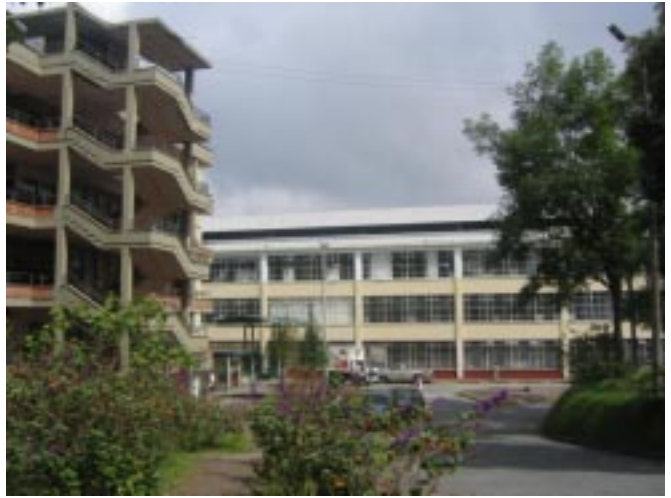
Detalle Universidad de Caldas Manizales - Colombia