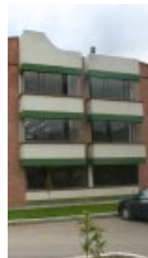
Detalle Edificio de aulas Rafael Azula Universidad Pedagógica y Tecnológica de Colombia - Tunja

Y sobre los filósofos americanos, cansados de figurarse, en sueños alegres, las maravillas prometidas por las revoluciones del mundo nuevo, quisieran retirarse al viejo, a distraer su imaginación, de las continuas pesadillas que les causan los sustos: en lo mejor del sueño despiertan despavoridos de haberse