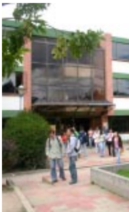
Detalle Edificio de aulas Rafael Azula Universidad Pedagógica y Tecnológica de Colombia - Tunja

regentó una escuela de primeras letras en un pueblecito de Rusia, como lo expresó en sus recuerdos sobre su estadía en el Viejo Mundo por más de veinte años. Estudió literatura, aprendió lenguas y concurrió a juntas secretas de carácter socialista. Trabajó en un laboratorio de química industrial, en donde aprendió algunas cosas experimentales. En 1823, Don Andrés Bello lo encontró en Londres, en donde decidió regresar a sus tierras americanas.