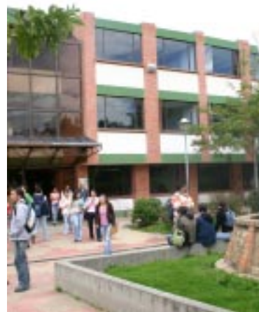
Detalle Edificio de aulas Rafael Azula Universidad Pedagógica y Tecnológica de Colombia - Tunja

La educación debe ser oficial y pública para todas las gentes. Así expresó: “El Gobierno republicano es protector de las Luces Sociales, porque sus Instituidores saben que sin luces no hay virtudes”. Existen varias especies de instrucción y su proyección en las virtudes sociales. La instrucción social para hacer una nación prudente. La instrucción corporal para hacerla fuerte. La instrucción técnica para hacerla experta y la instrucción científica para hacerla pensadora. Y para llegar al conocimiento profundo, es necesario leer y escribir, como han dicho todos los Congresos de América “no será ciudadano el que para el año de tantos no sepa leer y escribir”. Pero recalca el Maestro Rodríguez: “¿De qué sirve leer y escribir, si la persona no tiene ideas?. “Ideas!...Ideas!, primero que Letras”. La enseñanza ha de ser verbal y las lecciones conferenciales: todo otro modo, no es enseñar, sino confirmar o propagar errores” 15 .