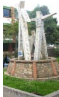
Detalle Edificio de aulas Rafael Azula Universidad Pedagógica y Tecnológica de Colombia - Tunja

El Maestro Simón Rodríguez tuvo un largo peregrinar por Europa, viviendo en Italia, Alemania, Prusia, Polonia y Rusia. Su principal actividad fue la docencia, la creación y dirección de algunas escuelas de español y hasta