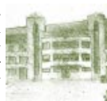
Universidad Pedagógica y Tecnológica de Tunja.

Este estudio se sustenta, en la historia social, con base en fuentes documentales primarias y secundarias. Es importante mencionar los Archivos de la Facultad de Educación de la Universidad Pedagógica y Tecnológica de Colombia, el Archivo General de la Nación, junto con el análisis de informes, cartas, periódicos, etc. También la búsqueda de información se extendió a Bibliotecas como: la Central de la Universidad Pedagógica y Tecnológica de Colombia, el Fondo Posada, la Biblioteca Luis Ángel Arango, entre otras.