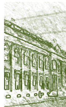
Facultad de Medicina y Ciencias Naturales Universidad Nacional de Colombia. Detalle.