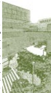
Universidad Pedagógica Nacional. Bogotá, Colombia.

Por otra parte, la Escuela Normal Superior de Bogotá, con el fin de realizar sus prácticas pedagógicas como laboratorio de experimentación, contó con instituciones anexas importantes y de trascendencia nacional e internacional, tales como: el Instituto Nicolás Esguerra, allí funcionó el Bachillerato y los estudiantes realizaron sus prácticas pedagógicas; el Instituto de Psicología Experimental, para la realización de pruebas y test psicológicos; el Instituto Etnológico Nacional, bajo la dirección del eminente antropólogo francés, Paul Rivet (1876-1958) 33 , el Instituto Caro y Cuervo; el Instituto Indigenista Colombiano dependiente de Extensión Cultural del Ministerio de Educación. Entre ellos cabe destacar a algunos de nuestros historiadores colombianos como: Jaime Jaramillo Uribe (1917 - ) 34 y nuestro benemérito profesor Eliécer Silva Celis (1914 - ) a quien le inculcó Rivet muchas enseñanzas que lo incentivaron a dedicarse a la investigación antropológica, como primogénito del Instituto Etnológico de Colombia y del Museo Arqueológico de Sogamoso.