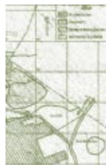
Mapa General de la UPTC. Detalle.

La Facultad, para sus distintas secciones, estaba provista de material de enseñanza, elementos de investigación, libros, instrumentos, laboratorios, aparatos de proyección cinematográfica, microscópica, etc. Los laboratorios de física, química y biología fueron completos y modernos. Así mismo el material para la enseñanza de la geografía, la historia, la biología y la higiene.