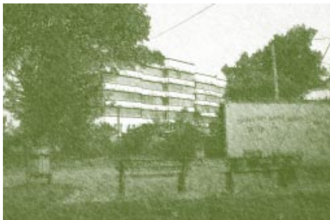
Universidad Pedagógica y Tecnológica de Colombia. Edificio Central

desempeñar tres funciones fundamentales: Primera, suministrar a sus alumnos los datos necesarios para la adquisición de una ciencia; segunda, la interpretativa, que presupone en ella la capacidad de discernir cuáles son las nociones que conviene enseñar con determinado propósito docente y la mejor manera de presentarlas al estudiante; por último, la inquisitiva, o sea la investigación de nuevas emociones. Esto se tradujo en exigencias diferentes, pues para llenar la primera condición era preciso ineludiblemente un profesorado instruido en la materia, sobre la base de un nivel mínimo de cultura universal; para la segunda es forzoso, y entre nosotros ello ha sido grandemente descuidado, un conocimiento metodológico.