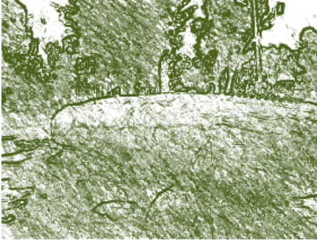
Monolito Ubicado en la UPTC. Detalle.

De tal forma que en este establecimiento, la enseñanza se hizo a base de la comprensión de las diferentes disciplinas científicas; por tanto quedaron proscritas las antiguas prácticas de leer y repetir un texto escolar. Siempre que la materia de estudio lo permitiera, señaló el profesor Sieber, los alumnos debían analizarla por su propia cuenta, valiéndose, según el caso, de experimentos, mediciones, construcciones, comparaciones, o del estudio de fuentes históricas. Allí prestaron sus servicios dos profesores alemanes, Alberto Reichel y Joseph Rulf, el primero formado en idiomas y el segundo en matemáticas, ambos de una gran preparación científica, puesto que dominaban ampliamente las materias de enseñanza y la metodología apropiada a cada una de ellas. La escuela abrió sus puertas por un periodo de un año, luego fue anexada a la Facultad de Educación de la Universidad Nacional en Bogotá.