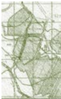
Mapa General de la UPTC. Detalle.

“Las excursiones era un medio o herramienta pedagógica para las prácticas pedagógicas...” 12