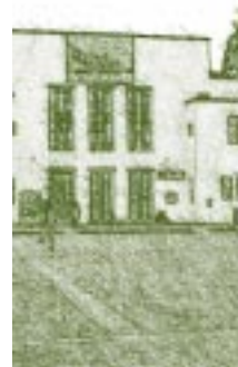
Facultad de Bellas Artes Universidad Nacional de Colombia.

“La Facultad de Ciencias de la Educación empieza a ser un basto laboratorio para el análisis de los problemas de la cultura colombiana y, el día en que su plan global se halla en la plenitud de su desarrollo, podrá ser el centro universitario más importante de nuestra América.” 22