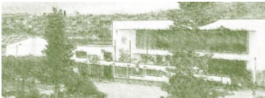
Universidad Pedagógica y Tecnológica de Colombia. Biblioteca Central.

para hombres. Dentro de las carreras se integraron cinco (5) Departamentos de especialización, entre ellos: “Facultades de Educación y Filosofía, Ciencias Sociales y Económicas, Filología e Idiomas, Matemáticas, Física y Biología y Química, etc. Cada especialización se hacía en cuatro años, pero fue cambiando hasta completar cinco años. También fue importante la preparación técnica del magisterio, especializó para los institutos industriales, escuelas de arte y oficios, escuelas agrícolas y demás ramas de la educación pública y privada del país.” 40