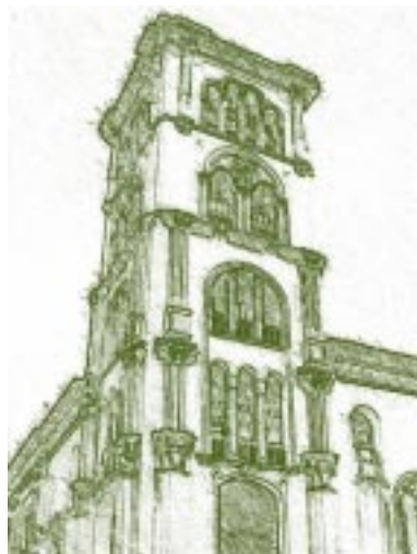
Universidad de Cartagena. Torre

La Cátedra nace como resultado e impacto de la tesis doctoral "La Historia de la Universidad de Cartagena Reforma y Modernidad 1.928-1.946." 1 que en su proceso investigativo, incluyo como fuentes la memoria viva de protagonistas o actores sociales que vivenciaron, en el periodo de la investigación, su recorrido por diferentes tiempos en la universidad y que en la interacción de recuerdos, se hizo necesario compartir con sus colegas. Esta dinámica o tertulia como inicialmente se denominó, vinculo a otros miembros de la comunidad académica en la recuperación de la historia institucional e hizo necesario, que sus resultados se fueran socializando en la comunidad universitaria por el interés en conocer cotidianidades institucionales, en recuperar asuntos propios de cada facultad; actividad que facilitó ampliar los archivos y fuentes, superando la deficiencia inicial de fuentes documentales, asunto que permitió vincular también, al entorno familiar de los egresados de la universidad en la búsqueda de tesis, diplomas, documentos y registros.