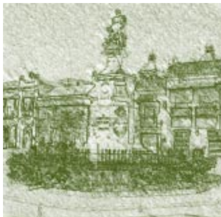
Estatua de Cristóbal Colón. Ciudad Amurallada, Cartagena - Colombia.

9.5 Conferencias de representantes de asociaciones científicas presentes en eventos en la ciudad de Cartagena y que serán invitados a las aulas de la Universidad como conferencistas.