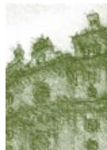
Plaza de San Pedro Claver. Claustro museo e iglesia

La Cátedra Universidad de Cartagena, hace parte del componente Socio-humanístico de los currículos de todos y cada uno de los programas académicos de la universidad; por lo tanto, sus contenidos serán una oferta de formación que estará distribuida en los planes de estudio de cada carrera profesional.