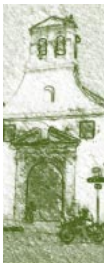
Iglesia de la Tercera Orden. Detalle.