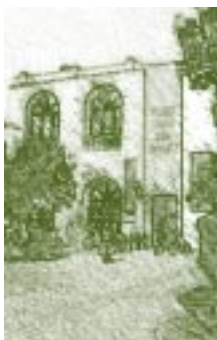
Museo Naval. Detalle.