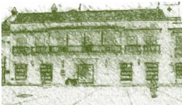
Casa del Premio Real, Cartagena de Indias.

La Cátedra Universidad de Cartagena: Desde el conocimiento de la historia de la universidad hasta la vinculación con el entorno de la ciudad, de la región y del país, y de los resultados investigativos que de ella se generen,