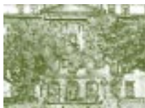
Antigua Escola de Engenharia. Universidade Federal de Rio de Janeiro, Brasil.

cada estudiante sacará el provecho de que es capaz, pero debe ser impartida con la preocupación simultánea de descubrir y cultivar talentos, y de aprovechar al máximo la capacidad real de cada estudiante.