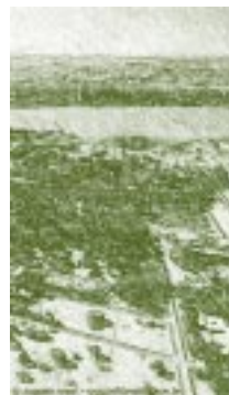
Universidad de Brasilia, Brasil.

El Presidente Joao Goulart intentó resolver los graves problemas sociales y económicos a través de una serie de medidas reformistas, que fueron obstaculizadas por las fuerzas conservadoras y por los militares, quienes lo