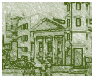
Curitiba. Brasília, Brasil. Detalle.

El educador brasileño Darcy Ribeiro reflexiona sobre las Universidades latinoamericanas: “La verdad es que los cuerpos académicos de las universidades latinoamericanas difunden más frecuentemente una actitud de resignación que explica el atraso como consecuencia de factores naturales inevitables, que una actitud de crítica indagativa”. Las Universidades latinoamericanas por tradición, educan a una juventud reclutada entre las capas más altas de la sociedad, para el ejercicio de las profesiones liberales, con el fin de cumplir actividades de gobierno, de producción y diversas modalidades de servicios indispensables al funcionamiento de la vida social. Son instituciones de educación superior que difunden la ideología de la clase dominante, contribuyendo así a la consolidación del orden vigente. 14