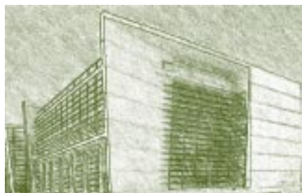
Edificio en Río de Janeiro, Brasil

Para llegar a lo más profundo del conocimiento y comprensión de los numerosos pueblos que han hecho