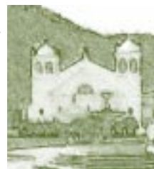
Sede Central de la Universidad Andina Simón Bolívar. Sucre, Bolivia. Detalle.

ción de sus recursos, el nombramiento de sus rectores, personal docente y administrativo, la facción de sus estatutos y planes de estudio, la aprobación de sus presupuestos anuales, la aceptación de legados y donaciones, la celebración de contratos y obligaciones para realizar sus fines y sostener y perfeccionar sus institutos y facultades. Podrán negociar empréstitos con garantía de sus bienes y recursos, previa aprobación legislativa”.