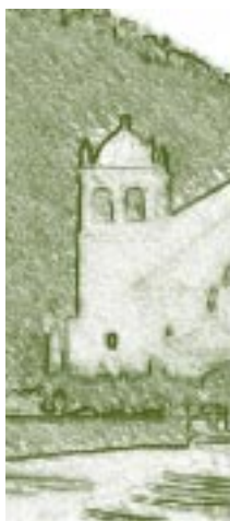
Sede Central de la Universidad Andina Simón Bolívar. Sucre, Bolivia. Detalle.