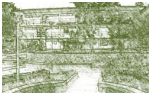
Universidad de San Cristóbal. Patio Central

propias normas o constituciones, su aparato académico y administrativo se guió por el modelo salmantino. Comenzó con las Facultades de Teología y de Artes o Filosofía; luego inauguró la de Cánones o Derecho Eclesiástico; después la de Leyes o Derecho Civil, y en el siglo XVII la de Medicina, carrera que entonces no gozaba de mucha atracción entre la juventud. Los estudios de gramática latina y filosofía eran obligatorios y de carácter propedéutico para todas las profesiones. Las formulaciones europeas se repetían con retraso en todas las materias. La filosofía estaba envuelta en ropaje religioso; el derecho compartía contenidos de los campos canónico y civil; la medicina era estudiada en los textos clásicos de Hipócrates, Galeno y Avicena. Una nota peruana, con el transcurrir del tiempo, fue el curso de quechua que permitió a los españoles comprender a los indígenas para adoctrinarlos en la fe católica.