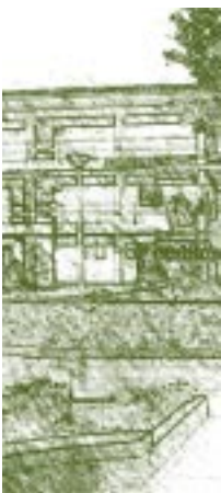
Universidad de San Cristóbal. Detalle.

La flamante institución universitaria se organizó con las mismas prerrogativas de la Universidad de Salamanca. Y si bien San Marcos elaboró sus