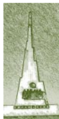
Obelisco en Ayacucho, Quinua