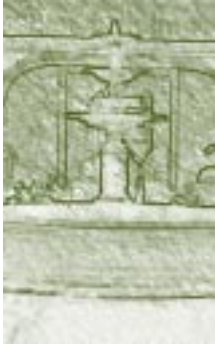
Casona de San Marcos, Perú. Detalle.

la causa, y por sus multiplicados importantes servicios al ejército libertador en las circunstancias más apuradas de la República”.