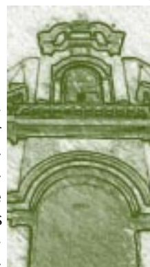
Plaza de Armas. Universidad Nacional de Trujillo. Detalle.

En todas las formas estables de sociedad, la educación ha sido un canal de transmisión de los valores culturales y modos de vida. Y junto a su complejidad revela tanto la magnitud de su poder liberador y transformador cuanto sus impotencias y deficiencias. Pero de todos modos, para introducir cambios en una realidad educativa es indispensable considerar sus fuerzas impulsoras a través del tiempo y distinguir las principales líneas que le imprimen dirección y sentido. En esta perspectiva, la motivación que antes tuvieron los hombres no debe omitirse para entender plenamente la problemática actual de las instituciones educativas. Éstas, incluidas las universidades, solo serán comprendidas a cabalidad en lo que son actualmente siempre que se estudien los hechos de mayor trascendencia de su desarrollo histórico.