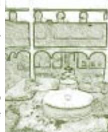
Universidad de San Marcos. Plazoleta Central.

La idea germinal para dar vida a una universidad en Lima se encuentra en el acuerdo tomado por los dominicos el 1 de julio de 1548, cuando celebraron su reunión capitular en el Cusco. En efecto, como estos religiosos estudiaban artes y teología en sus conventos de las dos ciudades mencionadas para, a su vez, preparar a sus novicios cuyo número aumentaba, resolvieron establecer un "estudio general" en el convento del Rosario, para cuyo efecto designaron lector de teología al prior fray Domingo de Santo Tomás, autor de la iniciativa, y al año siguiente comenzaron las clases. Este hecho habría motivado que los vecinos, interesados en el asunto, se pronunciaran a favor de solicitar una autorización oficial para contar con una institución universitaria.