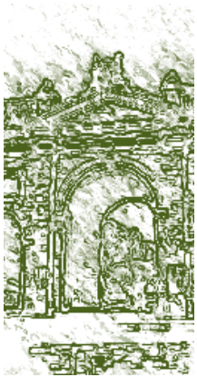
Arcos en la Universidad de San Cristóbal de Huamanga. Detalle.

a la región sublime te levantas, donde tus gotas son estrellas tantas que tornan con su luz la luz oscura. 6