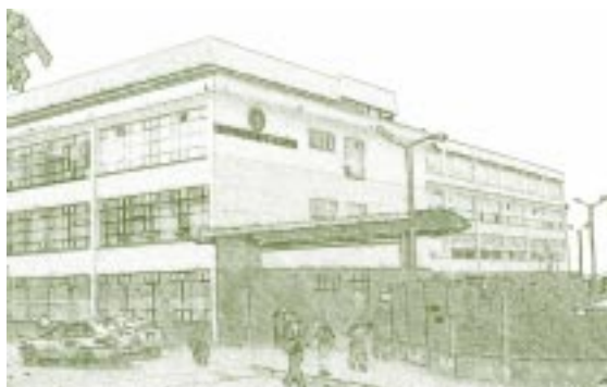
Universidad de Caldas. Sede Central.

munidad universitaria para que estudie (aprenda y desaprenda) sobre temas curriculares. No podemos seguir considerando que este sea un asunto exclusivo de expertos. Las reformas curriculares exigen el compromiso de todos. Valga aquí reconocer que se ha convocado a profesores y estudiantes, a través de sus representantes, a participar en el análisis y propuestas de ajuste sobre temas curriculares pero la respuesta ha sido tímida y escasa.