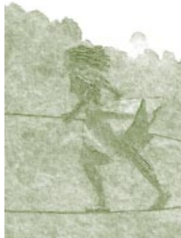
“Malabares”. Escultura del Maestro Alberto Reyes García. Programa Artes Plásticas. Universidad de Caldas. Manizales.

El diseño curricular finalmente adoptado con el aporte del Comité Universitario de Currículo creado para brindar apoyo con carácter de transito-