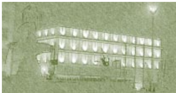
Centro de Cultura y de Convenciones, Teatro los Fundadores. Manizales.

riedad, tuvo su falla más protuberante y todavía no superada en el hecho de aplicar sin legitimar. En otras palabras, se han venido imponiendo desde la normatividad una serie de procedimientos, que careciendo de una fundamentación teórica, metodológica e investigativa, pretenden lograr resultados óptimos en materia académica. Como ejemplo basta mencionar: tres períodos académicos en un año, el segundo de ellos con alta carga de improvisación; 4 acatamiento parcial de reglamentación sobre tope de créditos por programa y metodologías a implementar con carácter urgente bajo el control de cronogramas restringidos.