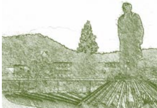
Monumento a Rafael Rangel. Mérida, Venezuela.

Los mensajes de los posteriores jefes de Estado, de 1837 (Andrés Narvarte) de 1838 y 1839 (Carlos Soublette) nada expresan sobre el ramo de Instrucción. Las memorias de los años 1837, 1838 y 1839 presentadas por los Secretarios del Interior y Justicia continúan planteando la necesidad de crear un plan General de Instrucción Pública. La Universidad, los Colegios Nacionales y las Escuelas quedaron relegadas a un plano muy secundario, y no podía ser de otra manera ante la escasez de recursos humanos y materiales (en 1841 el Secretario del Interior y Justicia era Ángel Quintero). El período comprendido entre 1830 y 1848, fue de relativa paz y ello permitió que se le fueran dedicando ciertos recursos a la educación y que se promulgara el Código de 1843. En 1838 se produjo la organización de la Dirección General de Instrucción Pública, creada el 17 de julio de ese año, cuando se designa a Vargas para presidirla, ocupándola hasta 1854 cuando se centraliza nuevamente en el Ministerio de Interior y Justicia el gobierno de la educación y se crea una sección en aquél despacho. En esta fecha el Poder Ejecutivo expide un Decreto que organiza la Dirección Nacional de Instrucción Pública. No