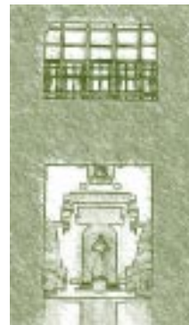
Pasillo de la Rectoría. Universidad de los Andes, Venezuela. Detalle.

Al frente del destino del país, el General Julián Castro encargado de "la organización provisional de la República", y una vez oído el informe de una comisión revisora de los Estatutos de enseñanza, 11 procedió a modificar la instrucción profesional o científica de las universidades. Las cinco facultades se transformaron en seis, a saber: la de Ciencias eclesiásticas, la de Ciencias Políticas, la de Ciencias Médicas, la de Ciencias Naturales, la de Ciencias Físicas, Matemáticas y Filosóficas, y la de Humanidades. 12 Así, se había operado una reforma, al menos desde el punto de vista formal con relación a los contenidos programáticos de las distintas materias de estudio. El 30 de junio de 1858, cuando el señor Jacinto Gutiérrez fuera Ministro de Relaciones exteriores, se promulgó nuevamente un Decreto del Ejecutivo Nacional por el cual se reorganizaban las universidades de Caracas y de Mérida en materia de estudios, cátedras y organización de las