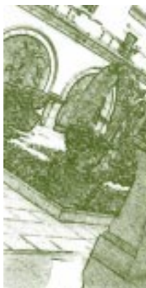
Claustro. Universidad de los Andes, Venezuela. Detalle.

facultades principalmente. El gobierno decretó que se podían admitir extranjeros y más aun solicitarlos si estaban fuera del país, para los ramos de "historia natural" y sus aplicaciones, 13 para las lenguas muertas, menos la latina, y para las lenguas extranjeras.