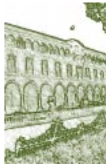
Palacio Municipal de Veracruz, México. Detalle.

La Universidad de México es una de las más antiguas universidades en el continente americano, junto con la de Santo Domingo y Lima, Perú y es hoy como Universidad Nacional Autónoma de México la de más prestigio en América Latina, según uno de los más recientes rankings internacionales. Esta Universidad que cambió de nombre a lo largo de los siglos, adaptándose el nombre a las circunstancias políticas, se fundó en el siglo XVI, poco tiempo después de la conquista, perduró toda la época colonial como institución clave del poder peninsular en la Nueva España, llegó a su decadencia a principios del siglo XIX, desapareció en 1865, para volver a nacer con nuevas estructuras, funciones y un papel diferente a principios del siglo XX. El recorrido histórico que presentamos aquí, terminará en el 1999, año de crisis más aguda provocada por una huelga estudiantil que cerró la Universidad Nacional Autónoma de México por diez meses, para reinventarse a partir del año 2000 acorde a los requerimientos de una competencia internacional de generación de saberes y formación de mejores profesionistas.