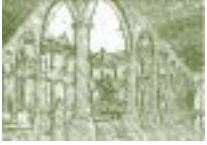
Universidad Real y Pontificia de México.

noviembre de 1999: la huelga estudiantil de abril de 1999 a febrero del 2000 21 que tuvo paralizada a la institución por más de nueve meses, hizo renunciar al rector, escindió a la comunidad académica. Lo que dejó estallar el movimiento estudiantil fue la iniciativa del rector a fines de 1998, que se aprobó en el consejo Universitario sin suficiente consenso en la comunidad universitaria, de ajustar las cuotas de matrícula estudiantil, conforme a las limitaciones del presupuesto y en congruencia con la política de cuotas seguida por las demás universidades públicas del país desde la década de los ochenta, y esto para cumplir con las recomendaciones de la OCDE al gobierno mexicano en 1996. El conflicto de 1999 se llevó a cabo dentro de los procesos políticos de la sucesión presidencial en el 2000 con expresiones de intereses de partidos políticos con fuerte presencia en el país y con la primera posibilidad real de sustituir el régimen del PRI, partido hegemónico en el panorama político mexicano desde su fundación en 1928, por un partido de oposición.