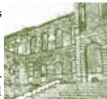
Vista Hermosa. Pueblo de Oaxaca, México. Detalle.

Hacia fines del siglo XVII la autonomía corporativa de la Universidad se vio estrechada por la Corona, lo que se tradujo en un poder de decisión cada vez mayor del elemento peninsular en una institución marcadamente criolla desde sus orígenes, y en una cada vez más limitada participación de estudiantes y bachilleres en el gobierno de la Universidad. Por lo que hace al aspecto administrativo, la Universidad siguió funcionando con una administración sobria a pesar de que había crecido notablemente desde sus orígenes. Pero en lo académico, los estudiantes universitarios seguían estudiando en libros que habían recibido como herencia medieval y la Universidad no se preocupó por renovar el saber, al contrario la lectura de estos textos recomenzaba, apenas sin modificación, año con año, y siglo con siglo.