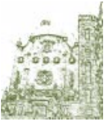
Universidad de Guanajuato. México. Detalle.

El rector presentó este análisis en abril de 1986 señalando los siguientes problemas institucionales graves: