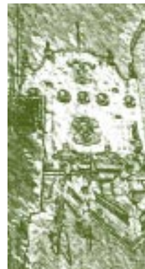
Universidad de Guanajuato. México. Detalle.

Con la toma de posesión de Plutarco Elías Calles como nuevo presidente de México en 1924, de José Manuel Puig Casauranc como secretario de Educación Pública y de Moisés Sáenz como subsecretario de la misma dependencia se ideó un nuevo proyecto educativo: al humanismo cristiano de Vasconcelos siguió el pragmatismo protestante de tipo estadounidense. La educación se consideró como parte de la política económica que contribuiría como sustento ideológico a la consolidación del Estado revolucionario. El subsecretario utilizó las instituciones creadas por Vasconcelos, las amplió y creó nuevas; pero su proyecto educativo era diferente: ahora, la educación se limitaría a ser instrucción que serviría a los mexicanos para desempeñar mejor su trabajo y elevar así su nivel de vida; por ello, el interés primordial de Moisés Sáenz era la educación básica en el campo y en las ciudades y además la educación secundaria, creada como un nivel educativo separado de la educación superior.