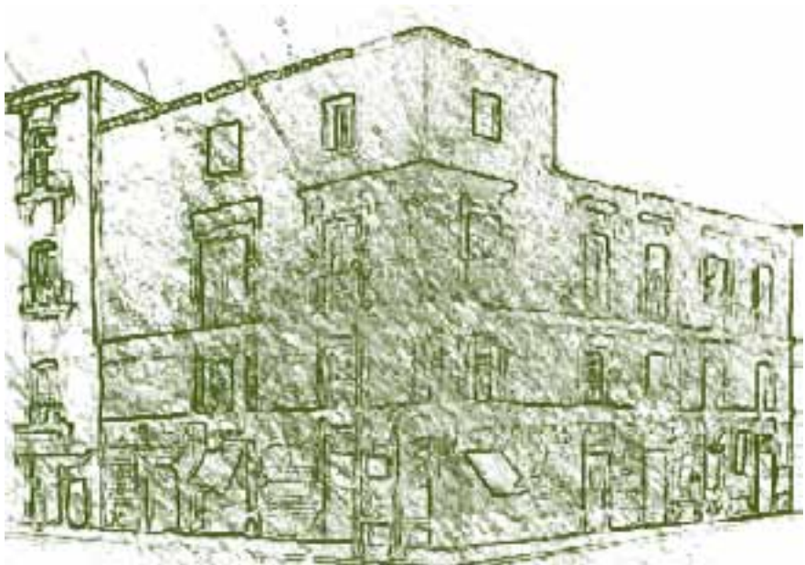
Escuela. Universidad Real y Pontificia de México.

University, colonial university, autonomy.