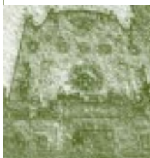
Universidad de Guanajuato. México. Detalle.

del Petróleo, tenía dos tareas importantes delante de él: inhibir la agitación estudiantil y asegurar la continuidad institucional, sobre todo en lo que se refería a las reformas emprendidas por el anterior rector. Él dejó participar a los representantes estudiantiles en las auscultaciones de la reforma y en la formación de las comisiones mixtas.