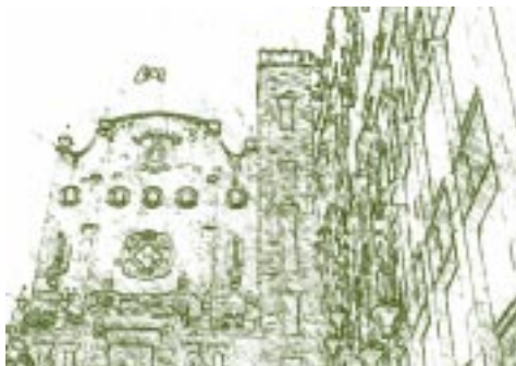
Universidad de Guanajuato. México.

La gestión del Rector Pablo González Casanova (1970-72) reconocido científico social a nivel internacional, estaba marcado por las secuelas del movimiento de 1968, en lo referente a sus posiciones políticas, a la situación interior de la Universidad y a sus proyectos de reforma universitaria. Ya desde su discurso de toma de posesión anunciaba “una democratización de la enseñanza” que significaría una apertura a grandes cantidades de jóvenes hasta ahora excluidos de los estudios de educación superior. Con ello recogió una de las demandas estudiantiles de los jóvenes de 1968.