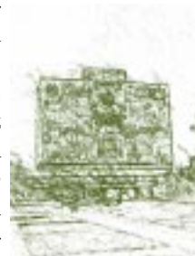
Biblioteca. Universidad Nacional Autónoma de México. (UNAM).

A partir de 1920, una vez terminada la lucha armada de la revolución, el país empezó a entrar a un período de mayor estabilidad política en busca de la aplicación del proyecto de la revolución mexicana. Los años veinte fueron los años de cambios y de fundación de instituciones; de búsqueda de la consolidación de un estado revolucionario y la cada vez mayor presencia de éste en todos los ámbitos de la sociedad; fue la época de la búsqueda de un proyecto educativo revolucionario y su aplicación en todos los rincones del país y a todos los niveles. También la Universidad Nacional vivía un clima de mayor estabilidad que le permitió concentrarse en su propio desarrollo y cumplir con uno de los fines para los que fue creada: impartir docencia a un nivel superior. Además, el fin de la lucha armada permitió que algunas instituciones, institutos y colegios de provincia se convirtieran en universidades estatales. Las primeras en aparecer fueron la Universidad de Michoacán y la Universidad de Sinaloa en 1917 y 1918 respectivamente. Le siguieron Yucatán en 1922; San Luis Potosí en 1923; Guadalajara en 1924; Nuevo León en 1932; Puebla en 1937, y Sonora en 1942. Durante las siguientes décadas, el resto de los estados mexicanos fundaron sus universidades estatales.