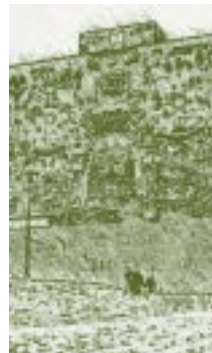
Universidad Nacional Autónoma de México. (UNAM). Detalle.

El rector sólo quedó una gestión, es decir cuatro años, al frente de la Universidad igual que su sucesor, Jorge Carpizo MacGregor, quien estuvo en su cargo del 2 de enero de 1985 al 2 de enero de 1989. El joven rector llegó con la propuesta de medidas de superación académica y de una reorganización administrativa, poniendo énfasis como sus antecesores en la planeación y la evaluación institucional y apoyando decididamente a la investigación con un mayor presupuesto y la incorporación de un representante del personal académico a los respectivos Consejos Técnicos. Sin embargo, los cuatro años de Jorge Carpizo se opacaron por el ya famoso documento "Fortaleza y debilidad de la UNAM", un diagnóstico crítico de la institución, que provocó el movimiento estudiantil de 1987 y la organización del Congreso Universitario en 1990 17 .