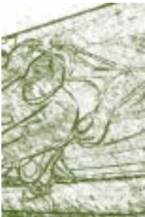
Universidad Nacional Autónoma de México. (UNAM).

Pero pocos meses después de inaugurada la Universidad, estalló en noviembre de 1910 el movimiento revolucionario y la Universidad se vio ligada en gran medida a las vicisitudes del conflicto armado. Los primeros años de la Universidad Nacional de México se caracterizaron por un rechazo de profesores y alumnos al movimiento revolucionario y a cualquier intento de modificar su statu-quo. Además, la nueva institución no se basaba en un proyecto bien estructurado, sino en buenas intenciones. En estas circunstancias, la Universidad no podía tener un desarrollo propio y mucho menos brillante, sólo podía tratar de sobrevivir.