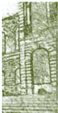
Vista Hermosa. Pueblo de Oaxaca, México. Detalle.