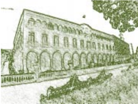
Palacio Municipal de Veracruz, México.

El gremio universitario tenía la capacidad de otorgar validez oficial a los estudios en virtud de una legislación propia que era sancionada por una autoridad competente. Como dicha sanción legal fue otorgada a la “universidad de todas las ciencias” mexicanas por el Rey de Castilla -el cual también la financiaba económicamente-, ésta llevó en su nombre el título de “Real”, mismo que luego de la Independencia cambió por el de “Imperial”, y, luego de la creación de la República hasta su clausura, por el de “Nacional”.