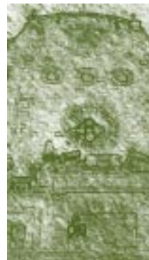
Universidad de Guanajuato. México. Detalle.

El nuevo rector, el ingeniero Javier Barros Sierra, eminente académico en su campo, ex secretario de Obras Públicas y director del Instituto Mexicano