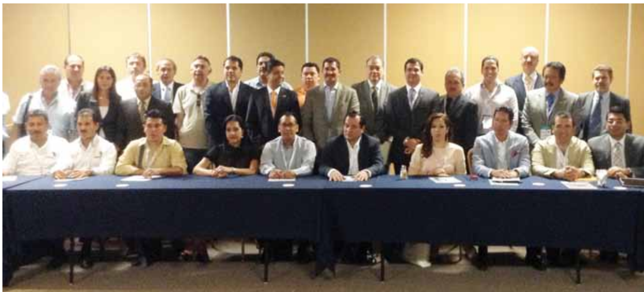
Integrantes del Consejo Directivo

señalando los principales resultados del proceso de modernización seguido por su municipio en el tema del catastro. El Tesorero Municipal de Atizapán de Zaragoza, Estado de México, presentó la ponencia denominada "Profesionalización y Certificación de Tesoreros Municipales", en la cual ponderó las ventajas que representan los procesos de capacitación y profesionalización de los responsables financieros en los Ayuntamientos del país.