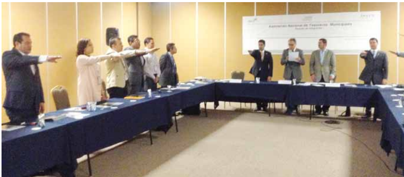
Aspectos de la toma de protesta a los integrantes del Consejo Directivo de la Asociación Nacional de Tesoreros de México (ANATEM).

municipios con el propósito de construir vínculos de interés compartido en los temas de la hacienda pública de este orden de gobierno, como es el caso de Asociación Nacional de Tesoreros de México (ANATEM).