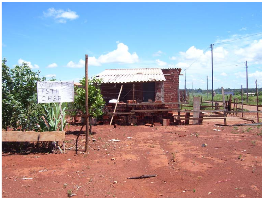
Figura 2 - Padrão de moradia do Residencial Triunfo

Raramente, possuem mais que dois quartos, comportando 4 a 5 pessoas em média, podendo chegar a mais. A regra é: casas com iluminação e sistema de ventilação inadequados, sem pintura, sem muros, com solos expostos, entulhos lançados na porta da casa e falta de vegetação, como se pode verificar na figura 2.