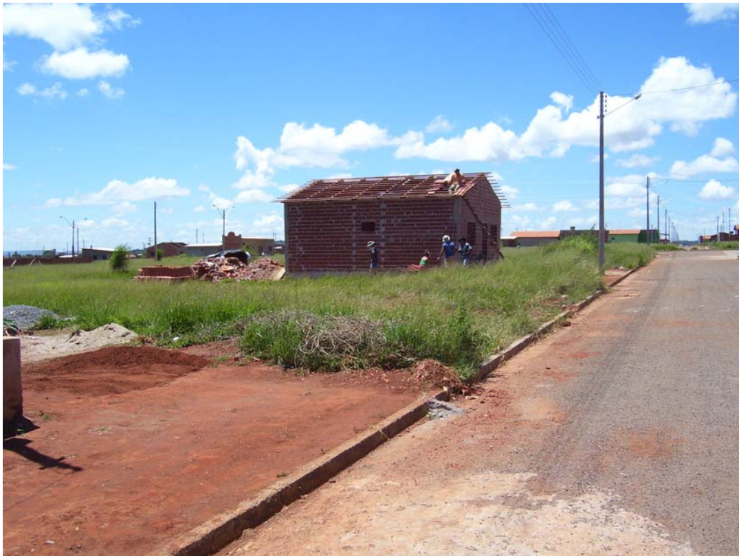
Figura 3 - Autoconstrução, Residencial Triunfo

Essas casas são construídas, em sua maioria, com ajuda de mutirões entre membros da família, e até mesmo vizinhos, denominadas de autoconstrução (vide figura 3). Grande parte destes moradores são proprietários de suas residências, o que os torna orgulhosos e satisfeitos, mesmo estando longe das condições “ideais” de habitabilidade e conforto. O sonho da casa própria realizado parece tolerar outras deficiências.