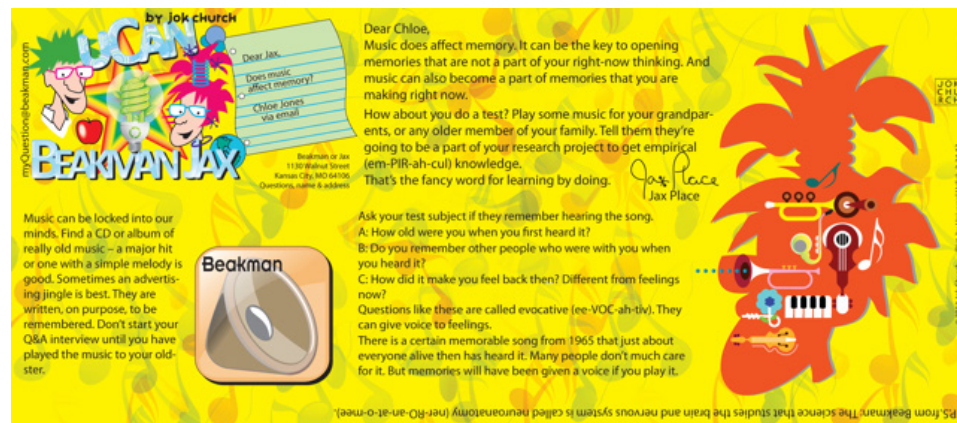
Beakman and Jax

Llevaba 6 meses publicando el cómic en el periódico local y enviándolo a todos los periódicos que podía. Algunos de los editores me pidieron que me detuviera, pero ¿por qué lo haría? Lo peor que podía hacer era parar. Así que lo seguí haciendo hasta que un día el Sindicato de Prensa Universal, que elegía tres nuevos proyectos al año, seleccionó el mío para distribuirlo en periódicos alrededor del país y varios fuera de él. Gracias a esto "Tú puedes con Beakman y Jax" pudo ser visto por miles de personas alrededor del mundo, en 6 lenguajes distintos y alcanzar un tiraje pico de 50 millones a la semana.