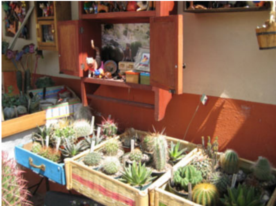
Imagen 8. Las cactáceas de México, tienen un alto valor ornamental. Deben elaborarse estrategias para su uso racional permitiendo que los pobladores que habitan las zonas semidesérticas resulten beneficiados por el cultivo y la venta de ejemplares, evitando así la extinción de las poblaciones naturales y propiciando el uso múltiple y sostenido de estos recursos.