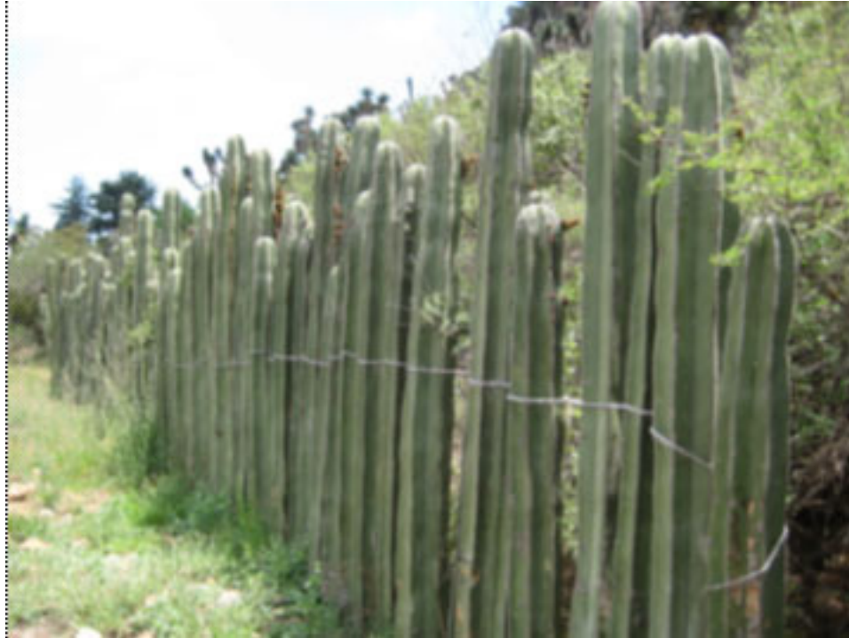
Imagen 2. Cerca viva, construida con los tallos del “órgano o chilayo” Marginatocereus marginatus , en Hidalgo. Esta especie es muy abundante y de amplia distribución en los estados del centro de México y era utilizada para la construcción de casas en las regiones donde crece.

En ambientes un poco más húmedos, con precipitaciones anuales de entre 300 y 1800 mm, donde se desarrollan bosques caducifolios, como los que se observan en la vertiente del Pacífico y en algunas regiones del Golfo (San Luis Potosí, Tamaulipas y Veracruz), suelen crecer cactáceas arbóreas como los pitayos, y otros órganos de los géneros Neubuxbaumia , Pachycereus y Cephalocereus , los cuales crecen intercalados con otros árboles mezquite, ( Prosopis spp. ), palo mulato ( Bursera spp. ) y Acacia spp. , entre otros (Bravo-Hollis y Sánchez-Mejorada, 1978).