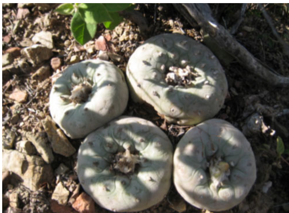
Imagen 1. Peyote de Querétaro, Lophophora diffusa . Esta especie crece en los estados de Hidalgo, Querétaro y San Luis Potosí. Sus poblaciones han sido fuertemente saqueadas debido a la belleza de sus tallos y a las cualidades de sus alcaloides. La especie está catalogada como Amenazada (A) por la NOM-059-ECOL-2001 y como vulnerable (VU) por la UICN (2004).

En los ambientes más áridos, con precipitaciones anuales menores a 600 mm, como ocurre en el desierto Chihuahuense (Coahuila, Nuevo León, Durango, Zacatecas, San Luis Potosí, Guanajuato, Querétaro, Aguascalientes, Estado de México e Hidalgo), abundan biznagas ( Ferocactus spp. , y Echinocactus platyacanthus ), cactáceas pequeñas como el “peyote cimarrón” ( Ariocarpus spp. ) y otras pertenecientes al género Astrophytum y Coryphantha , además de las biznaguitas o chilitos pertenecientes al género Mammillaria . En algunas regiones de este desierto se presentan poblaciones de peyotes ( Lophophora williamsii y L. diffusa ). También se encuentran grandes nopaleras formadas por poblaciones de diversas especies ( O. Streptacantha , O. leucotrich ) y Xoconoxtles o cardones ( Cylindropuntia spp. ). En algunas regiones de San Luis Potosí, Guanajuato e Hidalgo, existen zonas donde dominan los garmbullos ( Myrtillocactus geometrizans ), los pitayos ( Isolatocereus dumortieri spp. ), así como los chilayos ( Marginatocereus marginatus ) (Bravo-Hollis y Sánchez-Mejorada, 1978).