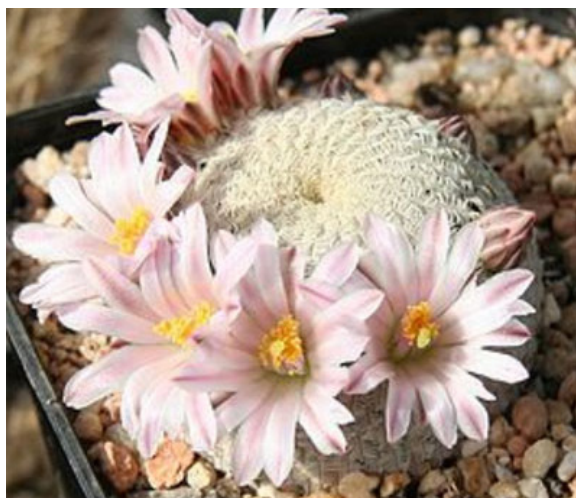
Imagen 7. Cactáceas mexicanas en riesgo