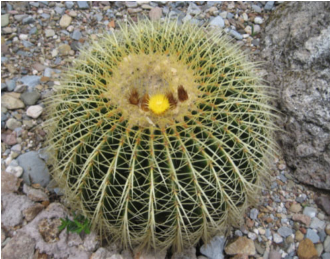
Imagen 5. Echinocactus grusonii “biznaga dorada”. Es una especie de belleza excepcional. Aunque existen ejemplares en los jardines botánicos de diversas partes del mundo, sus poblaciones naturales casi han desaparecido por completo. Su rango de distribución está limitado a algunas zonas de Querétaro e Hidalgo. La zona donde era más abundante ha quedado cubierta por las aguas de la presa de Zimapán, construida hace apenas una decena de años. La especie está señalada como en peligro de extinción (P) por la NOM-059-ECOL-2001 y la UICN (2004) la señala como especie en peligro crítico (CR).

En la depresión del Balsas encontramos también una gran diversidad de cactáceas, entre ellas algunas especies de los géneros Coryphnatha , Cephalocereus , Opuntia , Peniocerus , Peresklopsis y Stenocereus . Aquí habita el bellissimo órgano Backebergia militaris , especie endémica de Colima, Guerrero, Jalisco y Michoacán, en México (Bravo-Hollis y Sánchez-Mejorada, 1978).