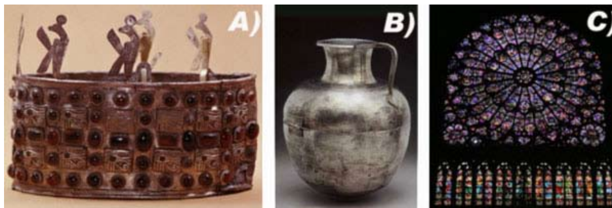
Figura 1. La figura muestra algunos de los usos que la plata tuvo en la antigüedad. A) Corona fabricada a partir de plata y piedras preciosas por los Egipcios. B) Vasija de plata de la época de los Romanos, este metal era comúnmente usado en contenedores y utensilios. C) Colorido vitral en la Catedral de Notre Dame donde se observan tonos amarillos los cuales provienen de nanopartículas de plata.