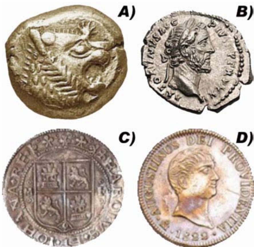
Figura 2. Monedas de plata de antiguas civilizaciones A) Primera moneda acuñada por el hombre, Imperio Griego en 610 A.C basada en una aleación oro/plata. B) Moneda del Imperio Romano hecha de plata pura, 269 A.C. C) Primera moneda del Imperio Español, 1536, acuñada en la Ciudad de México. D) Primera moneda acuñada en México como nación independiente, en el año de 1822, mostrando el perfil de Agustín de Iturbide.