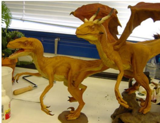
Fig.5.- Comparación entre un dinosaurio y un dragón. Se puede conseguir una representación del segundo simplemente añadiendo algunos elementos característicos al primero (por ejemplo, cuernos y alas). Maquetas realizadas por el artista soriano Javier Pérez Valdenebro para la exposición "Mitología de los dinosaurios".

hallazgo de restos de plesiosaurios. Los dinosaurios están también presentes como personajes sustitutivos de los dragones en la iconografía de "la bella y la bestia".