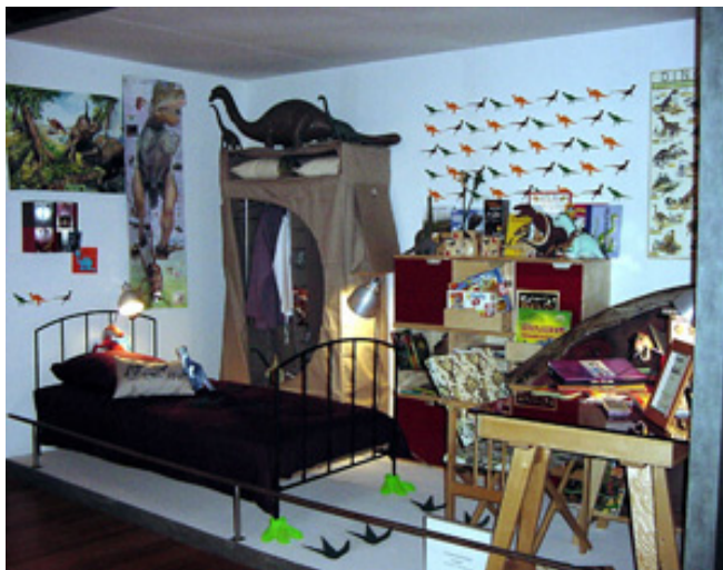
Fig.6.-Recreación del dormitorio de un niño/a dinomaniaco. Exposición "Mitología de los dinosaurios".

La dinomanía es el fenómeno sociocultural que aglutina la estructura de mito dinosauriano y la convierte en una manifestación real de los deseos y ensoñaciones de parte de la sociedad humana. Básicamente se trata de un "apetito desordenado" de acaparar información sobre los dinosaurios: su forma de vida, apariencia, tamaño, etc. La dinomanía es un fenómeno parecido al que surge sobre las estrellas del cine, el deporte o la televisión, y genera un deseo de proximidad que cristaliza en acaparar imágenes y otras representaciones gráficas de los dinosaurios (Fig.6).