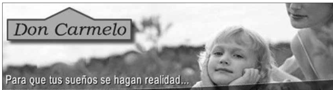
Gráfico 7. Promoción inmobiliaria. Folleto de promoción de loteo en alrededores de Rincón (2004)