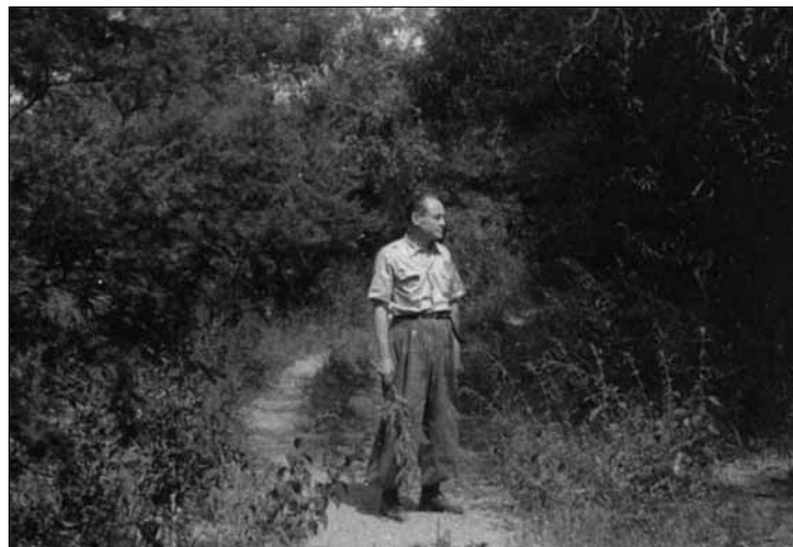
Gráfico 2. San José del Rincón en 1949. Fotografía en San José del Rincón, 1949.

Lo cierto es que Rincón, por ese entonces, constituía un poblado de cinco cuadras de radio, con poco más de 400 habitantes 7 y viejas casas semiderruidas, tapadas por el polvo que las calles levantaban. Sus habitantes, olvidados desde la década anterior, solicitaban la cons-