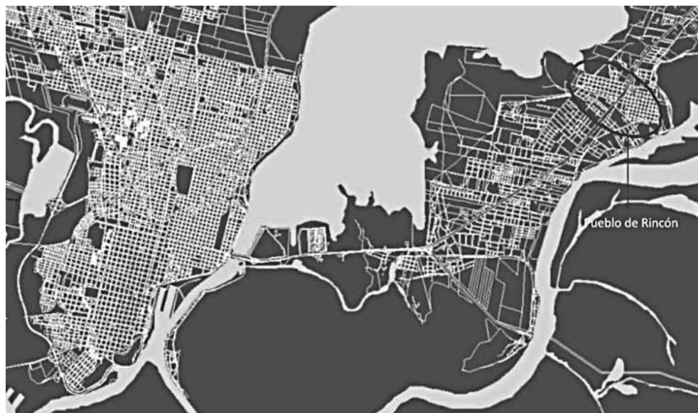
Gráfico 6. Santa Fe y periferia: plano de 2000. Parcelado en San José del Rincón y ciudad de Santa Fe (2000). Elaboración propia a partir del Plano de la ciudad de Santa Fe, Servicio de Catastro e Información Territorial de la Provincia de Santa Fe (SeCIT).