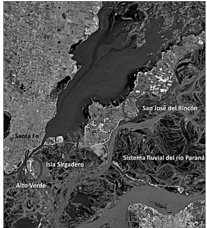
Gráfico 1. Ubicación del objeto de estudio. Imagen satelital de la ciudad de Santa Fe, Argentina, y el valle de inundación del río Paraná, 2004.