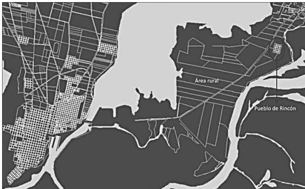
Gráfico 5. Santa Fe y periferia: plano de 1935. Parcelado en San José del Rincón y ciudad de Santa Fe (1935). Elaboración propia a partir del Plano de la ciudad de Santa Fe, editado por Colombo, 1935.