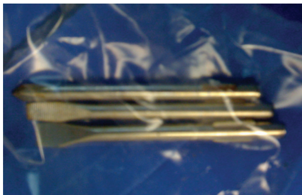
Figura 3. Tres cuerpos extraños tipo desarmador de 10 X 0.5 cm, extraídos por enterotomía y localizados en el yeyuno –a 40 cm del ligamento de Treitz.