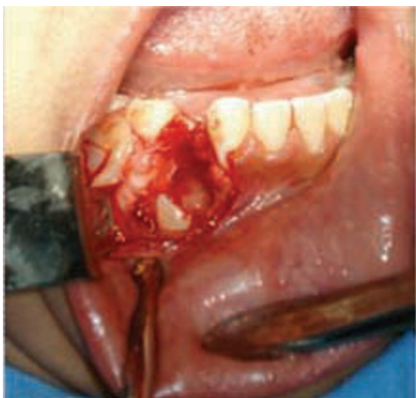
Figura 4. Transoperatorio. Se nota la corona del diente 43 posterior al curetaje de la cavidad.

e ibuprofeno a dosis de una tableta de 400 mg cada 8 horas durante 4 días; también se le entregaron indicaciones por escrito.