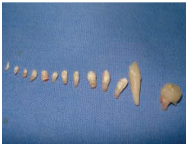
Figura 3. Transoperatorio. Se aprecia la imagen de la lesión enucleada, integrada por 11 dentículos y los órganos dentarios 83 y 84; este último fue extraído después de la enucleación de la lesión.