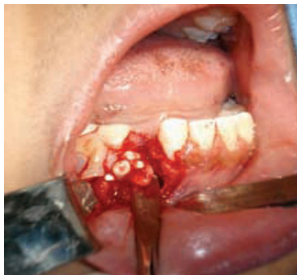
Figura 2. Transoperatorio. Se observa la enucleación de la lesión en la región inferior al órgano dentario 83.

Previa asepsia y antisepsia de la región, y bajo anestesia local con lidocaína y epinefrina al 2%, se infiltraron 2 cartuchos de 1.8 mL cada uno, y se procedió a la sindestomía, luxación, prensión y extracción propiamente dicha del diente 83. Posteriormente, se hizo una incisión trapezoidal de espesor total del órgano dentario 42 al 84, con una hoja de bisturí número 15 y mango número 3; se elevó el colgajo mucoperiostico con un periostótomo, y se efectuó osteotomía inferior a la región del órgano dentario 83 (Figura 2).