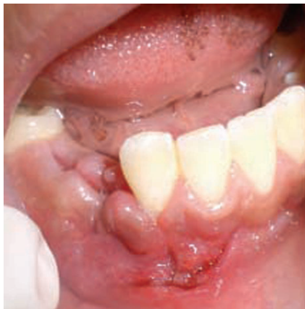
Figura 5. Posoperatorio inmediato. Puede observarse la herida de bordes afrontados, en vías de cicatrización.

patológico permitió establecer el diagnóstico definitivo de odontoma compuesto (Figura 5).