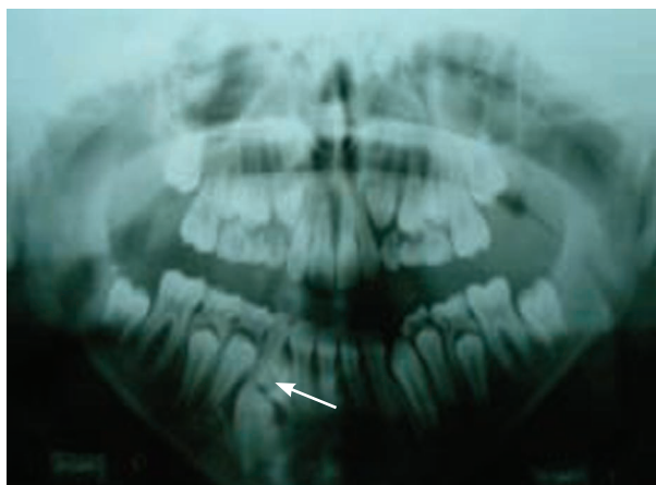
Figura 1. Radiografía panorámica. Se observa una imagen radiopaca limitada por un halo radiolúcido en la región apical del órgano dentario 83.

Se utilizaron auxiliares de diagnóstico tales como series radiográficas periapicales y radiografía oclusal y panorámica; en esta última se visualizó una imagen radiopaca de bordes definidos limitada por un halo radiolúcido, por debajo del órgano dentario 83, que obstaculizaba la libre erupción del órgano 43 (Figura 1).