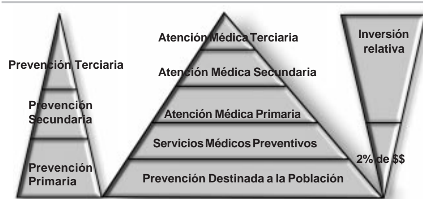
Figura 1. Triángulos de prevención

Si bien todos estos servicios son importantes para quienes los reciben, los servicios más cercanos a la base de la pirámide tienen una mayor repercusión sobre un mayor número de personas y durante un período más largo que los servicios a nivel secundario o terciario. El estrato denominado "servicios clínicos de prevención" se sitúa entre el nivel primario y el secundario de prevención, o se superpone a la línea que separa estos dos niveles. Este nivel de servicios abarca las medidas destinadas a prevenir las enfermedades (por ejemplo, vacunación) y a las que procuran lograr la detección temprana (por ejemplo, tamizado de la presión arterial o exámenes de la vista). Estos servicios podrían organizarse como servicios dirigidos a la población, tales como jornadas de vacunación a nivel nacional, o incorporarlos a la atención médica primaria personal.