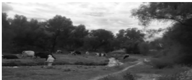
IMAGEN 3. CAMPESINO CON SU GANADO EN EL RÍO CHICALOTE