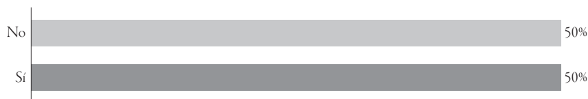
GRÁFICA 1. PERCEPCIÓN DEL RIESGO EN LA ZONA