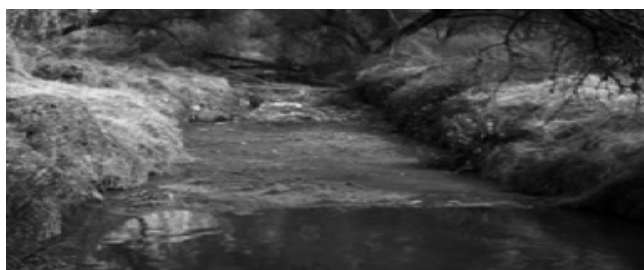
IMAGEN 4. RÍO CHICALOTE