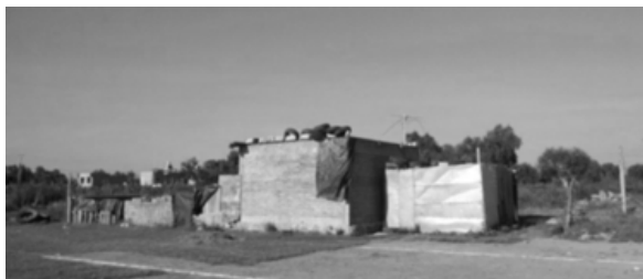
IMAGEN 1. VIVIENDA DANDO LA ESPALDA AL RÍO CHICALOTE