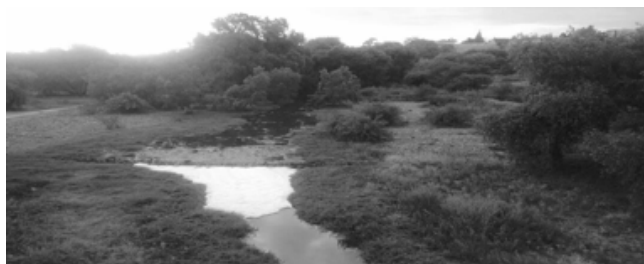
IMAGEN 2. RÍO CHICALOTE CON PRESENCIA DE ESPUMA