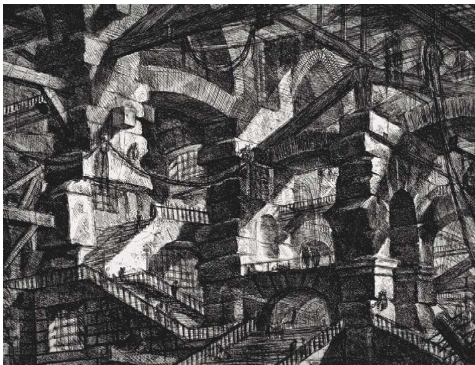
Figura 2. Las Carceri: “El Arco Gótico”, Giovanni Battista Piranesi (circa 1745)

Fuente: http://arthistoryblogger.blogspot.ca/2011/08/imaginary-prisons-of-piranesi.html