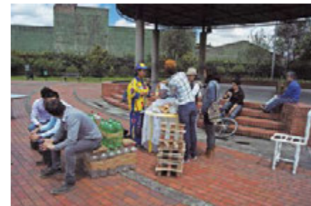
Figura 7. Primer Desayuno con caminantes