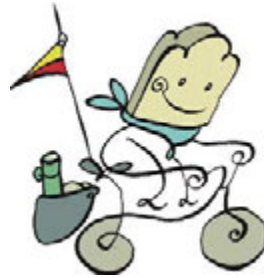
Figura 2. Logotipo oficial tostada en bici Fuente: diseño realizado por Andrés González (Gova), 2013.