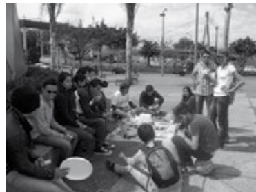
Figura 10. Cuarto Desayuno con caminantes