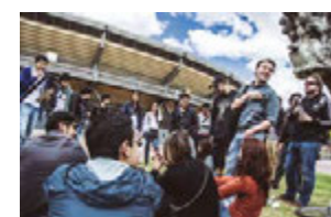
Figura 9. Tercer Desayuno con caminantes