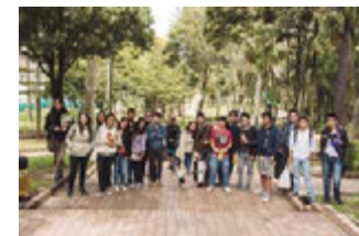
Figura 8 Segundo Desayuno con caminantes