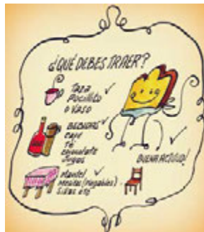
Figura 4. Logo de lo que debes traer para desayunar con los caminantes