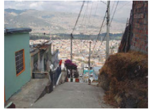
Figura 1. Panorámica del barrio La Paz