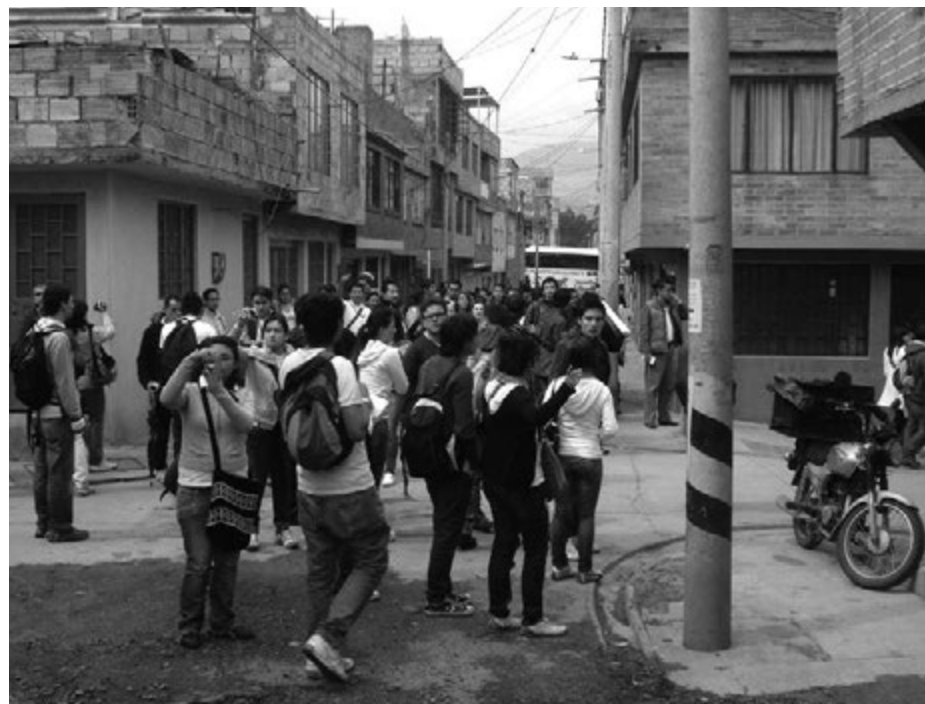
◀ Figura 7. Análisis de espacialidad de las viviendas Fuente: estudiantes Facultad de Arquitectura, Universidad Católica de Colombia.