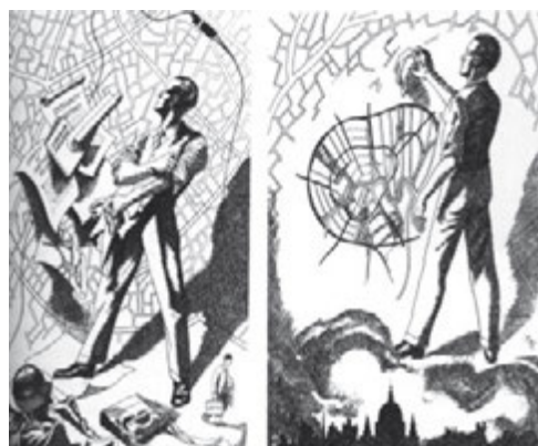
► Figura 5. Entre lo ideal y la compleja realidad de nuestras ciudades

Se sabía de antemano el reto tan complicado de asumir la opción de mejorar lo construido, pues conllevaba un trabajo dedicado e intenso, de filigrana, de estudio detallado de cada referente construido, y de una proposición a partir de lo existente. Una postura que en el contexto académico no era fácil defender.