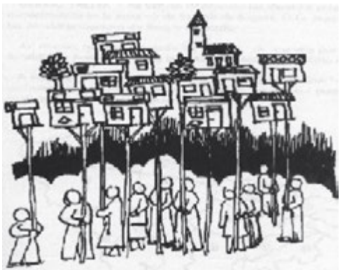
► Figura 6. Reivindicando el derecho a un techo

De esta revisión inicial, aun sin ir al barrio, se fue fundamentando una postura colectiva en torno a la idea de mejorar lo construido 1 , de negarse a desconocer lo existente y a demolerlo, a menos que hubiese una justificación técnica para hacerlo. De hecho, en la ciudad se ha venido discutiendo la necesidad de consolidar estas áreas de mejoramiento integral, considerando las posibilidades de densificación y redensificación en favor de una ciudad densa y compacta 2 .