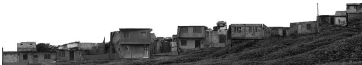
Figura 15. Perfil urbano de la manzana por intervenir.

Este segundo escenario, que se denominó hipotético, hace referencia a la intervención de la manzana y de cada una de las viviendas o predios, apegándose solo de manera parcial (no totalmente, como en el escenario real) a la realidad encontrada. Si bien desde el enfoque del taller se optó a lo largo del semestre por no demoler lo existente, se decidió proponer este otro escenario paralelo en el que si bien se partía también de los levantamientos realizados, se puso