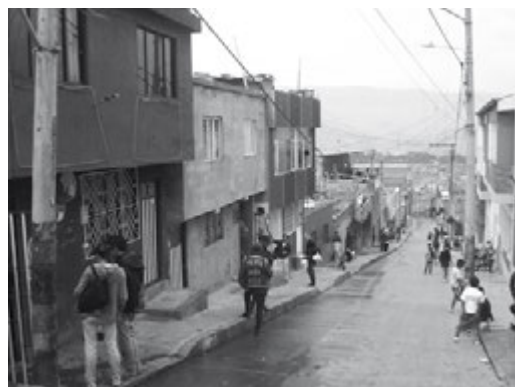
Figura 14. La manzana intervenida desde la quebrada La Marranera y desde la diagonal 53 C sur