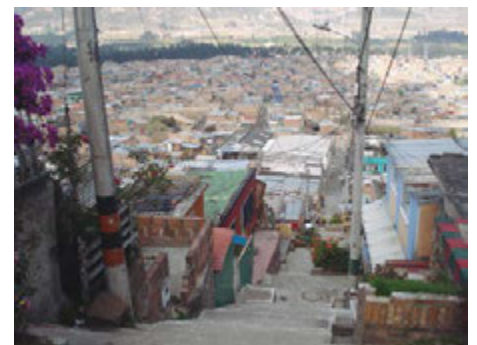
Figura 3. Imagen aérea del barrio La Paz