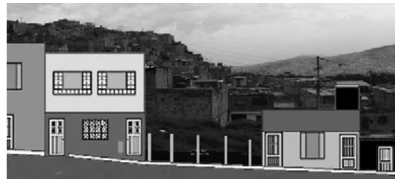
Figuras 16 y 17. Intervenir la espacialidad existente. Montaje: estudiantes de la Facultad de Arquitectura, Universidad Católica de Colombia.