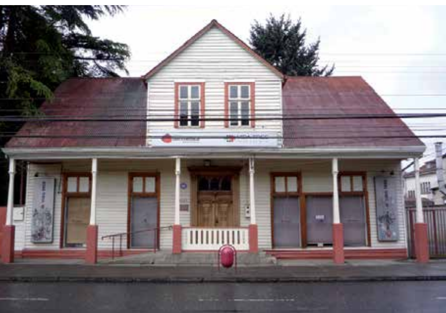
Figura 1. Vivienda unifamiliar en Osorno. Periodo de la colonización alemana, circa 1900

a modernidad y racionalidad frente a respuesta local), explicarían la ocurrencia simultánea de continuidad y cambio. De aquellas se desprende el siguiente interrogante: ¿De qué forma responde la arquitectura de vivienda unifamiliar de Osorno a dichas tensiones? Teniendo tal punto de partida, los objetivos específicos que se plantea el trabajo son: 1) visitar, redescubrir y registrar la arquitectura de vivienda unifamiliar moderna anónima de Osorno; 2) afinar un método de estudio de la vivienda unifamiliar moderna para emplear en posteriores investigaciones de la línea, y 3) realizar el ajuste de las hipótesis de trabajo para obtener las hipótesis por responder en futuras investigaciones de la línea.