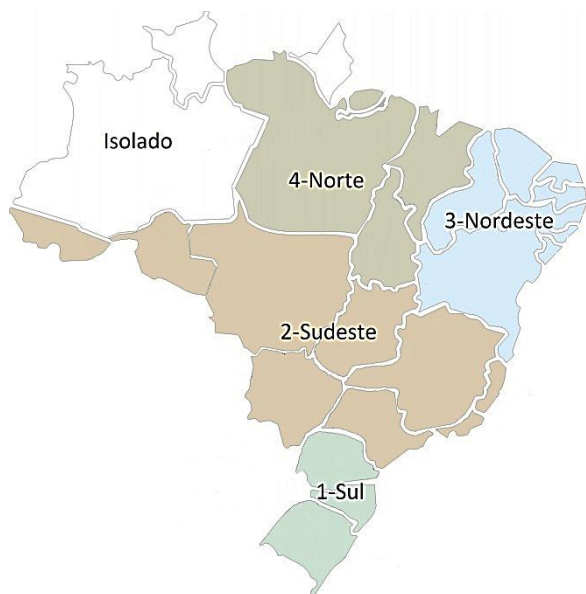
Figura 1 – Divisão de subsistemas do SIN

O presente estudo foi feito sobre as séries de vazões naturais. Isso significa dizer que todos os efeitos oriundos da instalação e operação dos reservatórios, bem como ações antrópicas em geral nos cursos d'água, são retirados. Braga et al. (2009) apresentam um estudo com as considerações necessárias para a obtenção de aflúências com tais características. É importante ressaltar, contudo, que o processo de naturalização das vazões não exclui a possível condição de não estacionariedade, pois esta se relaciona com uma grande quantidade de fatores de difícil mensuração.