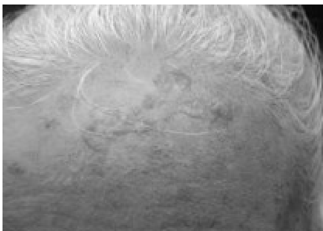
Figura 2. Ceratose actínica em frente de mesma paciente da Figura 1.